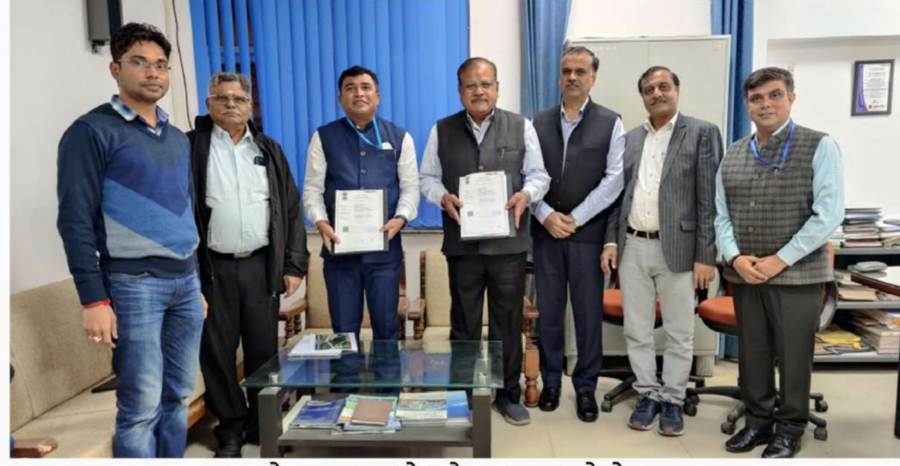
समझौता ज्ञापन के दौरान ग्रुप फोटोग्राफ

टीएचडीसी इंडिया लिमिटेड और भारतीय राष्ट्रीय राजमार्ग प्राधिकरण (एनएचएआई), पुणे के मध्य "तकनीकी सलाहकार" के रूप में टीएचडीसीआईएल द्वारा तकनीकी सेवाएं प्रदान करने के लिए टीएचडीसी के कॉर्पोरेट कार्यालय, ऋषिकेश में 24 नवंबर 2023 को एक समझौता ज्ञापन (एमओयू) पर हस्ताक्षर किए गए।