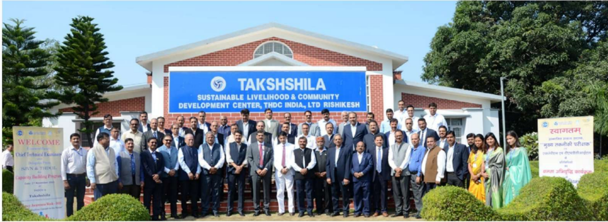
A group photograph during the programme

THDCIL organized a Capacity-building programme for senior executives of SJVN and THDCIL