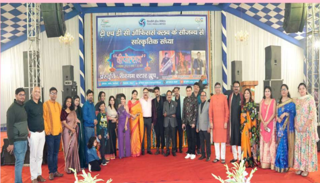
खुर्जा परियोजना में आयोजित दीपोत्सव की झलक