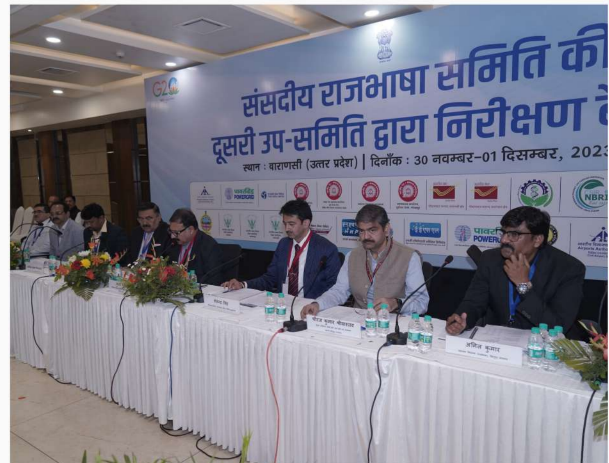
राजभाषा निरीक्षण की कुछ झलकियाँ