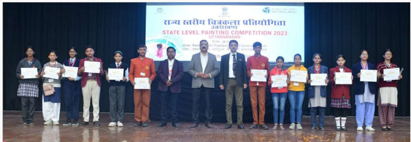
Some snapshots of the event