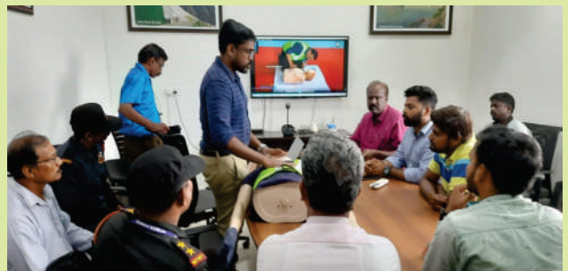
A view during the training programme

A first-aid training programme was conducted for all the technical and security staff posted at THDCIL's 50 MW Solar Power Project, Kasaragod, Kerela on 11 July 2023. The training programme was coordinated by Medical Officer, Government Hospital, Meenja, Kasargod. During the training programme, the employees were trained in life-saving techniques like CPR, First-aid after electrical shock, dog bite, snake bite, burning injuries etc.