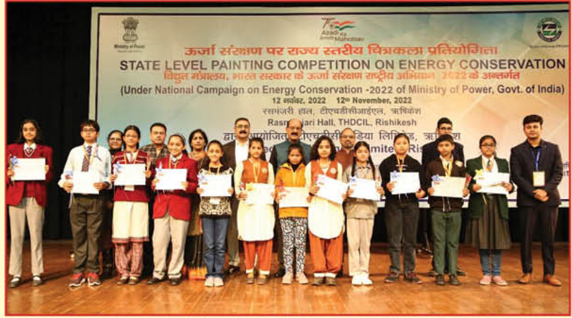
राज्य स्तर की चित्रकला प्रतियोगिता का दृश्य