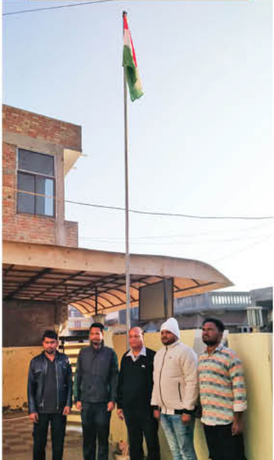
गुजरात के पाटन पवन फार्म (50 मेगावाट) परियोजना में गणतंत्र दिवस के आयोजन का दृश्य