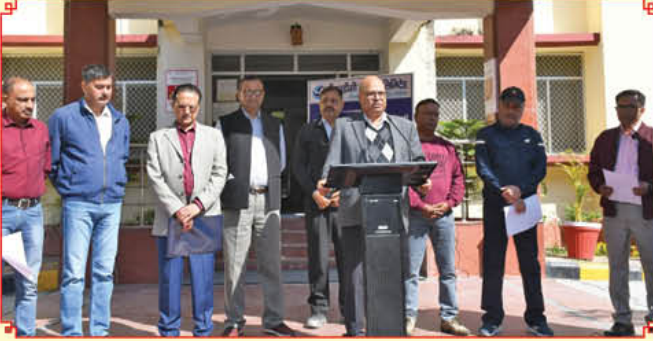
विष्णुगाड-पीपलकोटी जल विद्युत परियोजना में शपथ ग्रहण का दृश्य