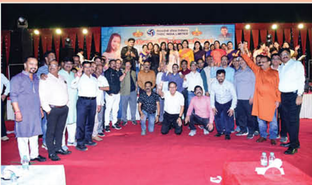
दीपावली के अवसर पर 21 अक्टूबर, 2022 को खुर्जा परियोजना में सांस्कृतिक संध्या के आयोजन का दृश्य