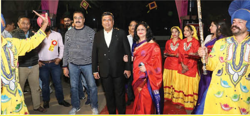
कॉरपोरेट कार्यालय में दीपावली मेले के आयोजन का दृश्य