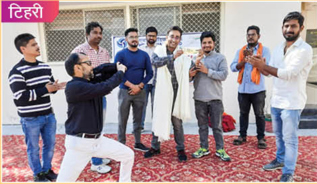
टिहरी परियोजना में विशेष अभियान 2.0 के अंतर्गत 27 से 28 अक्टूबर, 2022 को नुककड़ नाटक के आयोजन का दृश्य