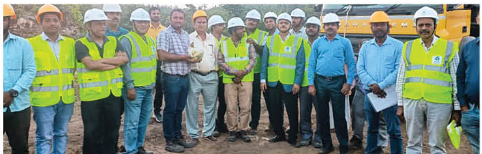
Some glances during the opening ceremony of Amelia Coal Mine

Overburden in Mine will be removed by drilling & blasting methods and coal will be extracted by cutting technology.