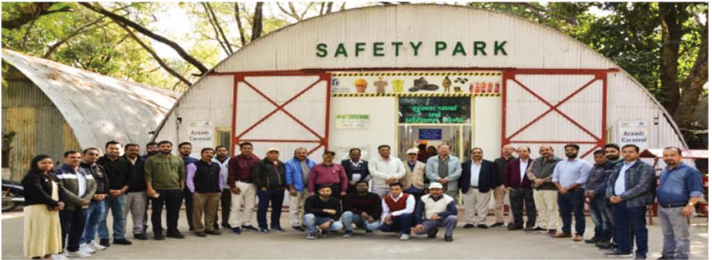
A group photograph during the training programme

In compliance with CEA Regulation 2011, Factory Act 1948 and BOCW Act 1996, a three-day certification programme on First Aid was organized by Corporate HRD at Safety Park, Rishikesh for officers and workmen across all projects and