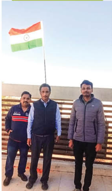
देवभूमि द्वारका पवन फार्म (63 मेगावाट) परियोजना में गणतंत्र दिवस के आयोजन का दृश्य