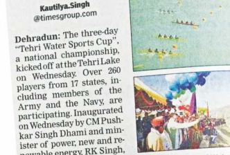
The three-day 'Tehri Water Sports Cup' was inaugurated by CM Dhani and Union minister RK Singh. The event is considered crucial for qualifying for the Asian Championship and Olympic Qualifying 2022-23. Separate race courses of 200m, 500m, 1000m and 2000m are set up for the participants.