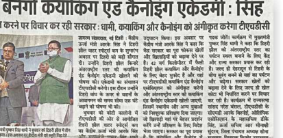
मध्य प्रदेश के मुख्यमंत्री ने टिहरी झील में एक क्याकिंग एंड कैनोइंग एकडेमी का उद्घाटन किया। यह एकडेमी कायक प्रतियोगिताओं के लिए एक बेहतरीन स्थल होगा।