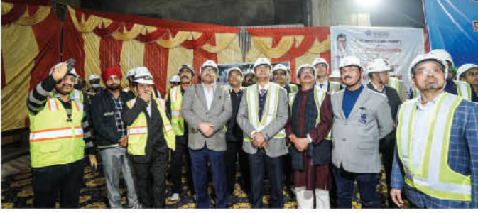
वेरिबल स्पीड मशीन के रोटर लोअरिंग का दृश्य

भारत में अपनी तरह की पहली वेरिबल स्पीड मशीन के रोटर को श्री आर. के. सिंह, माननीय कैबिनेट मंत्री, विद्युत, नवीन एवं नवीकरणीय ऊर्जा मंत्रालय, भारत सरकार की गरिमामयी उपस्थिति में टिहरी पीएसपी प्लांट (4x250 MW) के जेनरेटर पिट (यूनिट-05) में दिनांक 27 दिसम्बर 2022 को सफलतापूर्वक संस्थापित किया गया। इस अवसर पर