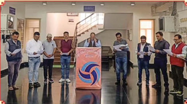
कोटेश्वर परियोजना में शपथ ग्रहण का दृश्य