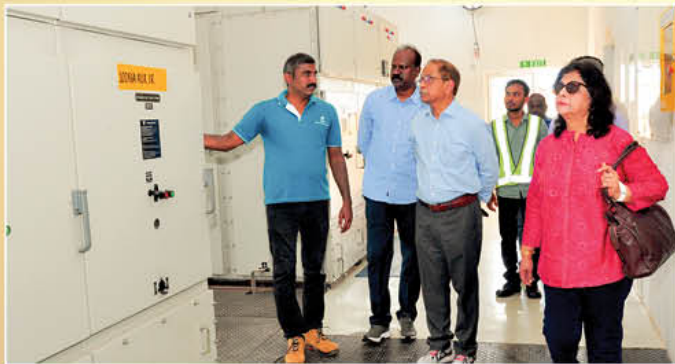
A view during the IEM visit to 50 MW Solar Power Project, Kasaragod