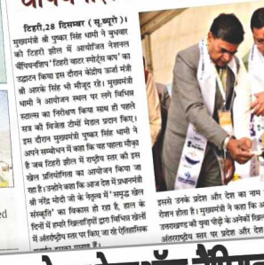
मुख्यमंत्री ने कहा कि टिहरी झील में आयोजित नेशनल चैंपियनशिप 'टिहरी वाटर स्पोर्ट्स कप' का उद्घाटन किया गया। यह एक ऐतिहासिक अवसर है। उन्होंने कहा कि यह प्रतियोगिता देश के प्रतिभाशाली खिलाड़ियों को प्रदर्शित करने का अवसर है। उन्होंने कहा कि यह प्रतियोगिता देश के प्रतिभाशाली खिलाड़ियों को प्रदर्शित करने का अवसर है। उन्होंने कहा कि यह प्रतियोगिता देश के प्रतिभाशाली खिलाड़ियों को प्रदर्शित करने का अवसर है।