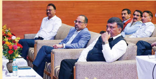
Glimpses of a talk organized on Corruption Free India- Developed India