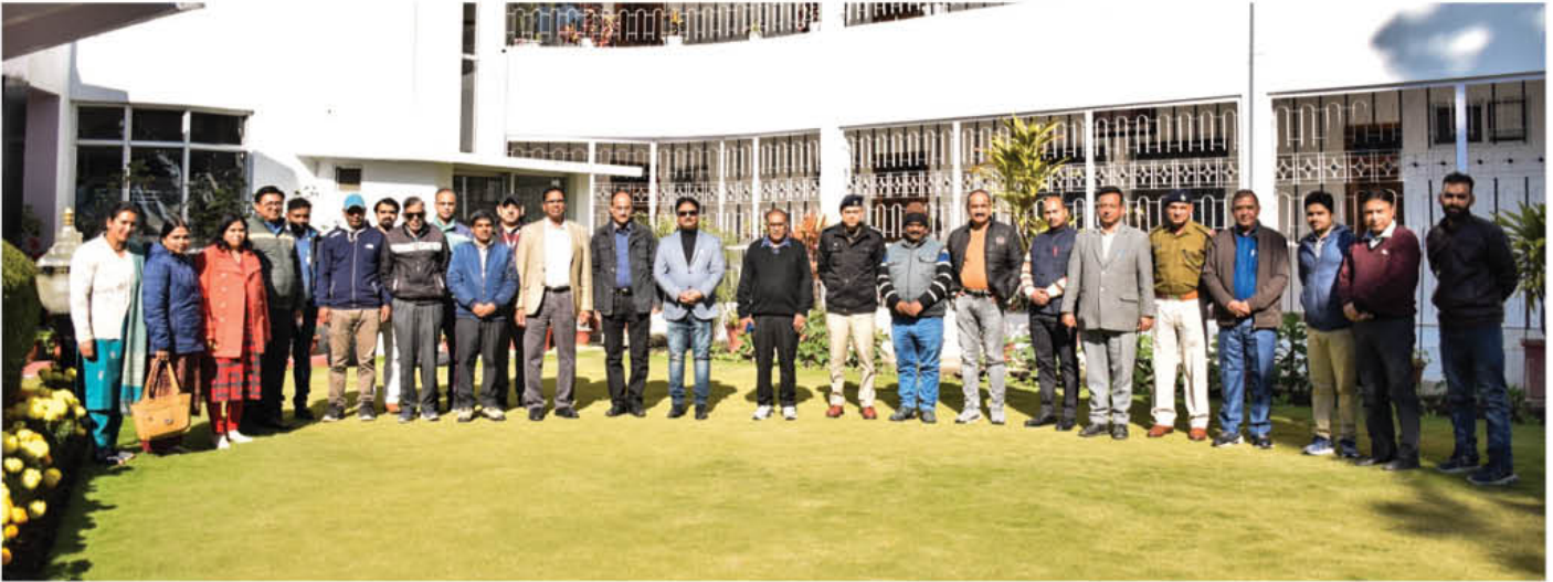
टिहरी परियोजना कार्यालय में 16 दिसम्बर, 2022 को नगर राजभाषा कार्यान्वयन समिति, टिहरी की 24वीं अर्धवार्षिक बैठक के आयोजन का दृश्य