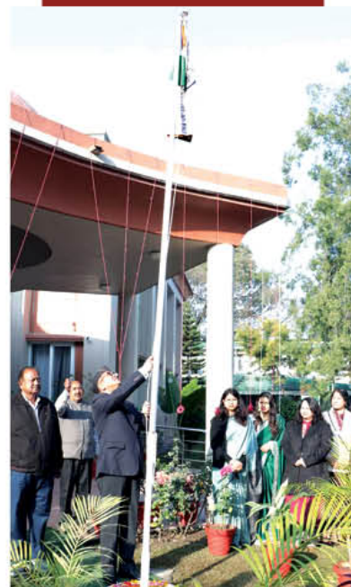
देहरादून कार्यालय में ध्वजारोहण का दृश्य