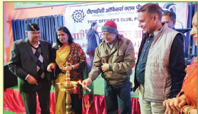
विष्णुगाड-पीपलकोटी जल विद्युत परियोजना में दीपावली मेले के शुभारंभ का दृश्य