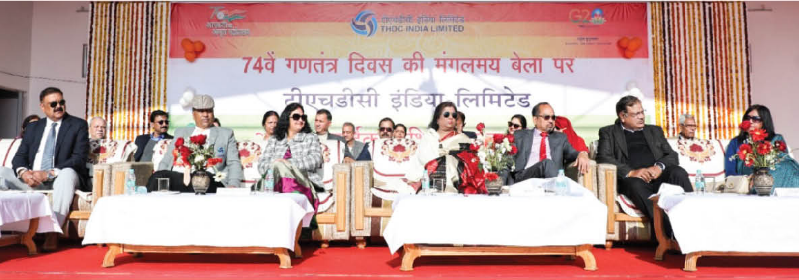
कारपोरेट कार्यालय में गणतंत्र दिवस के आयोजन का दृश्य