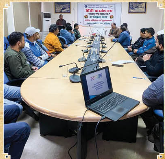
कोटेश्वर परियोजना कार्यालय में 07 दिसम्बर, 2022 को हिंदी कार्यशाला के आयोजन का दृश्य