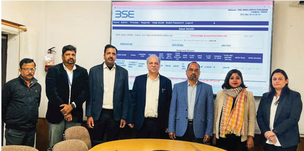
A group photograph during the bidding process at Corporate Office Rishikesh