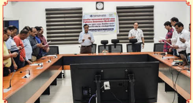
केएसटीपीपी में शपथ ग्रहण का दृश्य