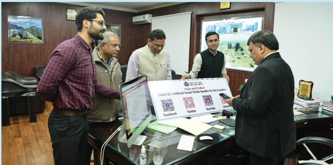
Chairman and Managing Director scanning the launched QR Codes

Subsequent to the inauguration of this QR Code initiative, these codes were installed at various important & prominent locations. This intervention will help in better accessibility to our Social Media Handles which will further improve userbase & stakeholders engagement with THDCIL's digital media handles.