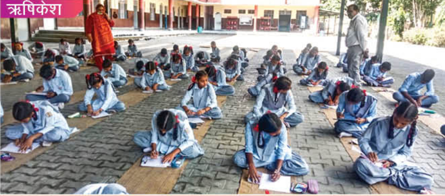
कॉरपोरेट कार्यालय में टीईएस स्कूल के विद्यार्थियों हेतु स्वच्छता विषय पर चित्रकला प्रतियोगिता के आयोजन का दृश्य

टीएचडीसी इंडिया लिमिटेड के कॉरपोरेट कार्यालय सहित सभी परियोजना इकाइयों में विशेष अभियान 2.0 के अंतर्गत स्वच्छता एवं लंबित मामलों के निस्तारण हेतु 02 अक्टूबर से 31 अक्टूबर, 2022 तक अधिकारियों/कर्मचारियों द्वारा विभिन्न स्वच्छता जागरूकता अभियान चलाए गए।