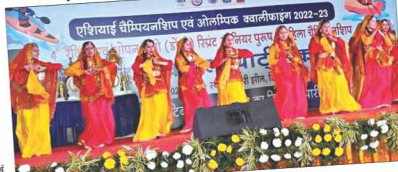
मध्य प्रदेश की टीम ने टिहरी वाटर स्पोर्ट्स कप में ओवरऑल चैंपियनशिप जीती। उन्होंने 13 स्वर्ण पदक जीते। सेना की टीम ने 11 और आईटीवीपी की टीम ने 8 गोल्ड जीते।

एमपी के हिटसे आए 13 स्वर्ण पदक, सेना को 11 और आईटीवीपी को मिले 8 गोल्ड