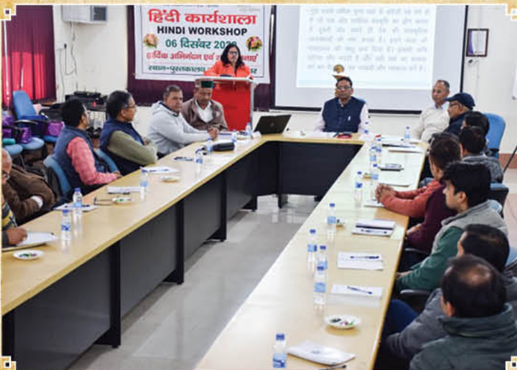
टिहरी परियोजना कार्यालय में 06 दिसम्बर, 2022 को हिंदी कार्यशाला के आयोजन का दृश्य