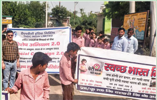
विशेष अभियान 2.0 के आयोजन का दृश्य