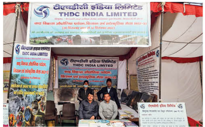
मेले में वीपीएचईपी द्वारा प्रदर्शित स्टॉल का दृश्य