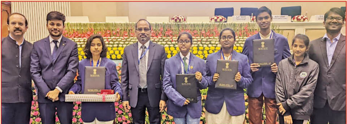
राष्ट्रीय स्तर की चित्रकला प्रतियोगिता के समापन का दृश्य