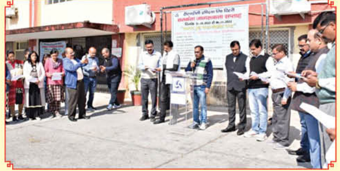
टिहरी परियोजना में शपथ ग्रहण का दृश्य