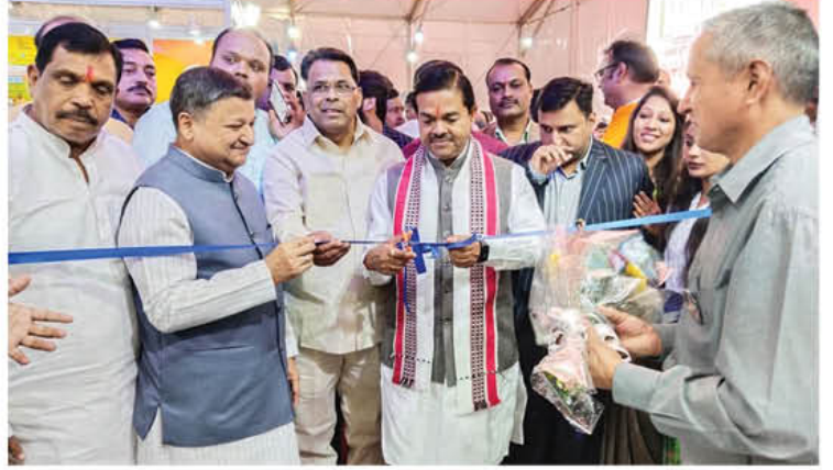
टीएचडीसीआईएल द्वारा लगाए गए स्टॉल के उद्घाटन का दृश्य

उल्लेखनीय है कि उक्त प्रदर्शनी में टीएचडीसीआईएल द्वारा लगाए गए स्टॉल को "सर्वश्रेष्ठ स्टॉल" घोषित किया गया।