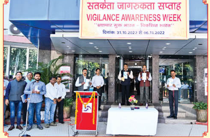
सतर्कता जागरूकता सप्ताह के शुभारंभ का दृश्य