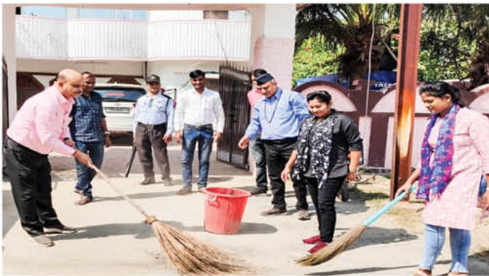
अमिलिया कोल माइन परियोजना में आयोजित स्वच्छता अभियान का दृश्य