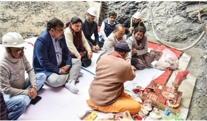
निदेशक (वित्त) द्वारा पूजा-अर्चना के साथ आउटलेट स्ट्रक्चर्स के संरचनात्मक कार्यों के शुभारंभ का दृश्य

श्री जे. बेहेरा, निदेशक (वित्त) द्वारा 18 व 19 नवम्बर, 2022 को टिहरी एच.पी.पी. व पी.एस.पी. परियोजनाओं का दौरा किया गया। इस दौरान निदेशक (वित्त) ने पी.एस.पी. के निर्माण कार्यों की प्रगति की समीक्षा की तथा कार्यरत अधिकारियों एवं कर्मचारियों का परियोजना के शीघ्र निर्माण हेतु