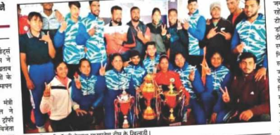
मध्य प्रदेश की टीम ने टिहरी वाटर स्पोर्ट्स कप में ओवरऑल चैंपियनशिप जीती। उन्होंने 13 स्वर्ण पदक जीते। सेना की टीम ने 11 और आईटीवीपी की टीम ने 8 गोल्ड जीते।

नई दिल्ली, 30 दिसम्बर (स.ह.): टिहरी वाटर स्पोर्ट्स कप में मध्य प्रदेश की टीम ने ओवरऑल चैंपियनशिप जीती। उन्होंने 13 स्वर्ण पदक जीते। सेना की टीम ने 11 और आईटीवीपी की टीम ने 8 गोल्ड जीते।