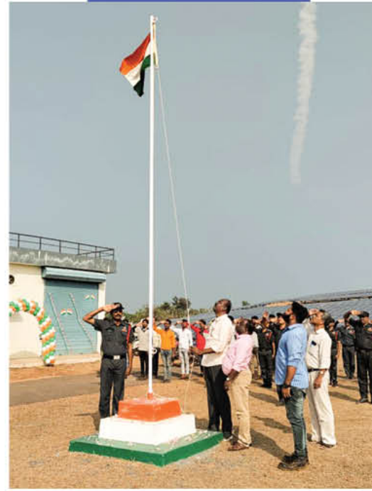
कासरगॉड सोलर पॉवर प्रोजेक्ट, केरल में ध्वजारोहण का दृश्य