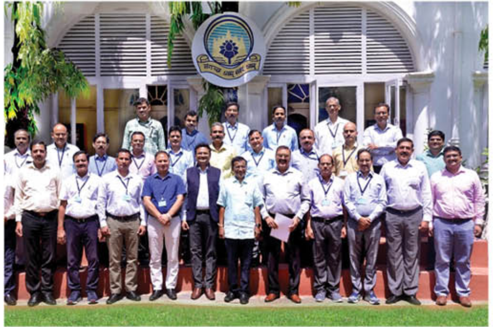
A group photograph of the AMP at ASCI, Hyderabad