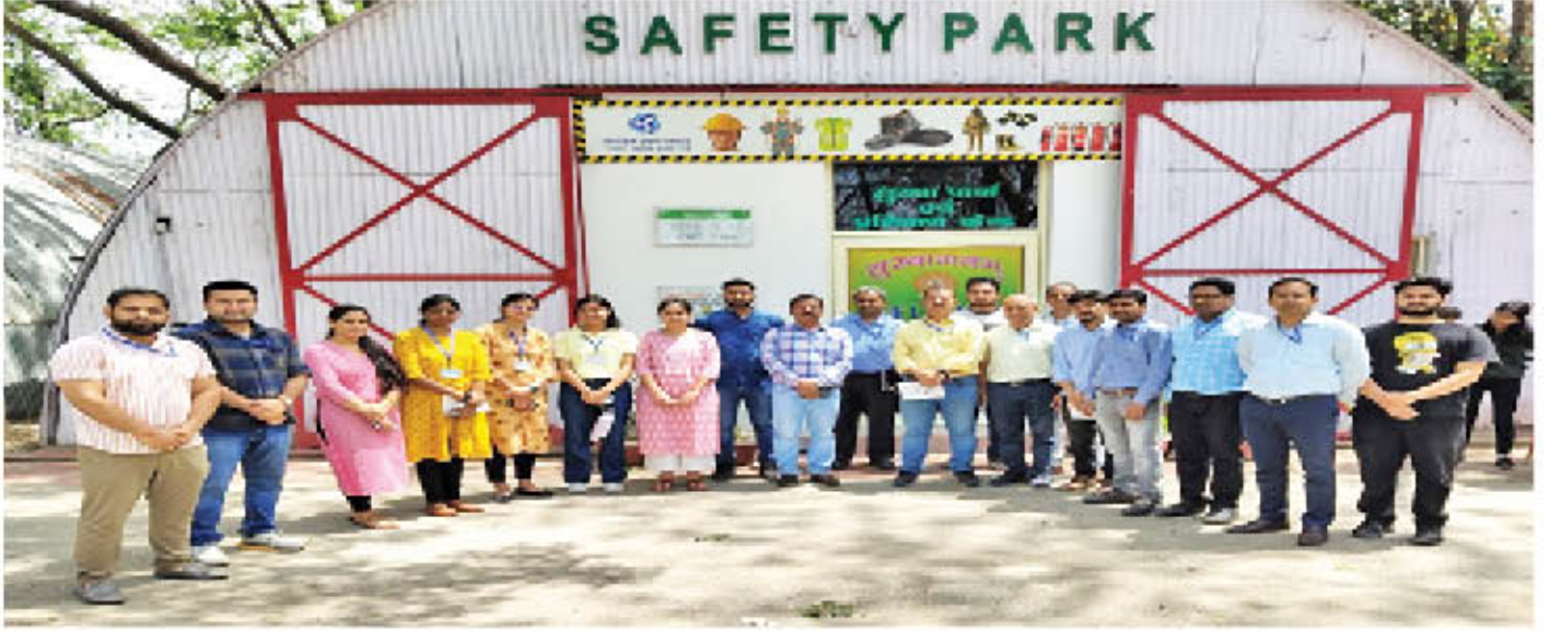
ऊंचाई पर कार्य के प्रशिक्षण कार्यक्रम के दौरान ग्रुप फोटोग्राफ

का उद्देश्य सभी कर्मचारियों को सुरक्षा प्रोटोकॉल और ऊंचाई वाले कार्य स्थल पर काम करने से जुड़ी सभी प्रकार की प्राथमिकताओं से अवगत कराना था।