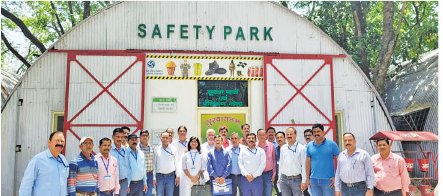
कार्य स्थल सुरक्षा के प्रशिक्षण कार्यक्रम के दौरान ग्रुप फोटोग्राफ