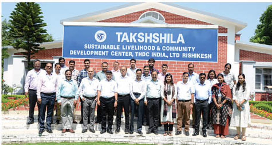
A group photograph during the programme

A sensitization training programme was organised on 16th June 2023 for Liaison Officers and officials dealing with the matter to provide an opportunity to gain knowledge and exposure to the latest Rule position and GoI Guidelines.