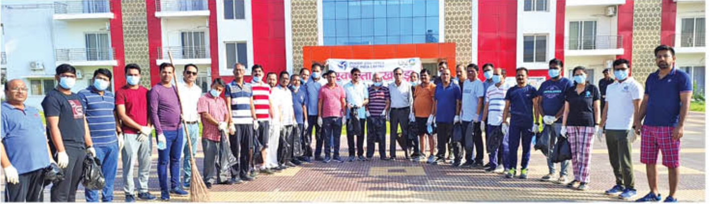
केएसटीपीपी में स्वच्छता पखवाड़े के आयोजन का दृश्य