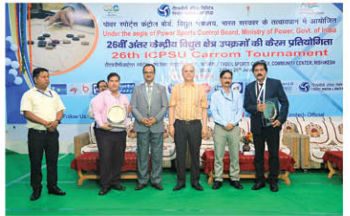
समापन समारोह का दृश्य