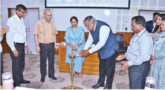
कॉरपोरेट कार्यालय, ऋषिकेश में विश्व पर्यावरण दिवस पर आयोजित कार्यक्रम के दृश्य