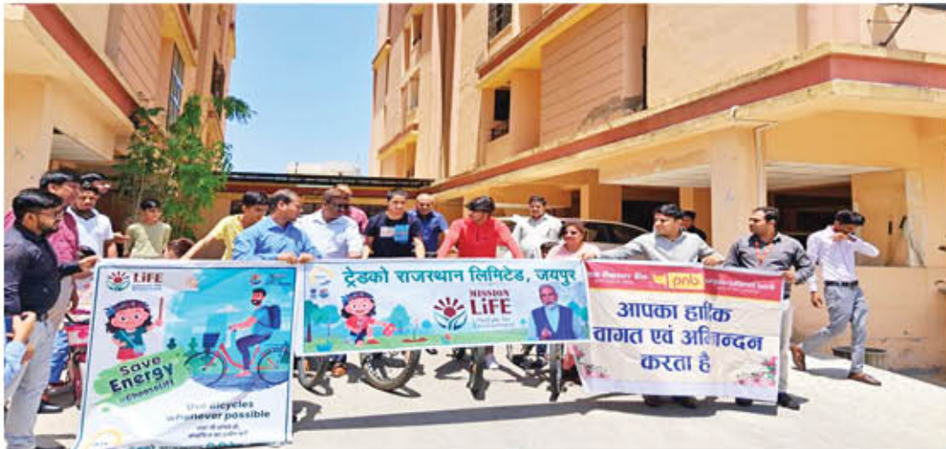
ट्रेडको राजस्थान लिमिटेड द्वारा पंजाब नेशनल बैंक के सहयोग से विश्व पर्यावरण दिवस का आयोजन किया गया।