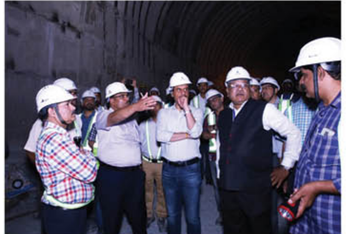
निदेशक (तकनीकी) के परियोजना दौरे के कुछ दृश्य