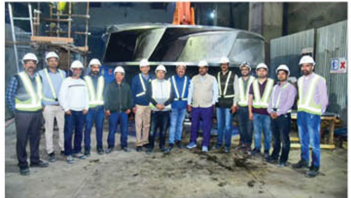
Some snapshots of the occasion