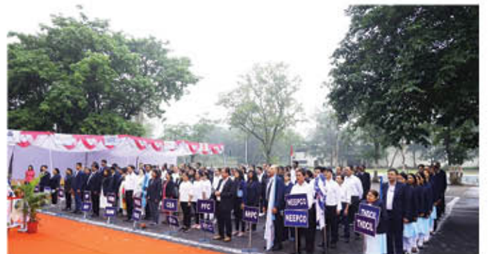
कार्यक्रम के दौरान सभी प्रतिभागी टीमों का दृश्य