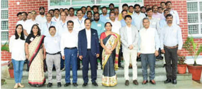
A group photograph during the workshop