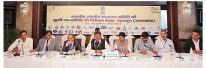
टिहरी यूनिट में राजभाषा कार्यान्वयन की समीक्षा का दृश्य