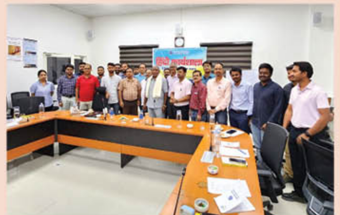
हिंदी कार्यशाला के आयोजन का दृश्य