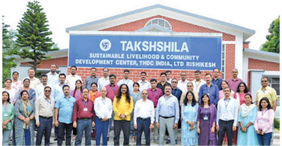
A group photograph during the programme

A motivational training programme on the topic “Together we make a Blissful Society” was organised from 02nd to 04th June, 2023 at Takshshila - Sustainable Livelihood and Community Development Centre, Rishikesh. Total 27 participants attended the programme. Spouses of the participants were also invited to attend this programme.