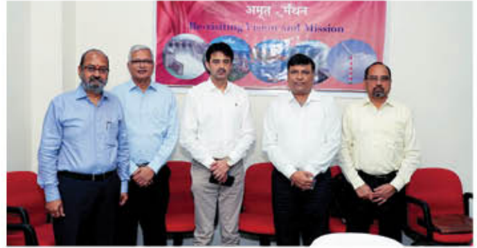
Glimpses during the workshop

To ignite a renewed sense of purpose and with intent to realign the Vision, Mission, Values and goals of THDC India Limited and to evolve new Shared Vision that inspires and guide us as we progress towards our goals, THDC India Limited organized workshops in different sessions starting from 16 June 2023 to revisit & revise the Vision, Mission and Values of the organization.