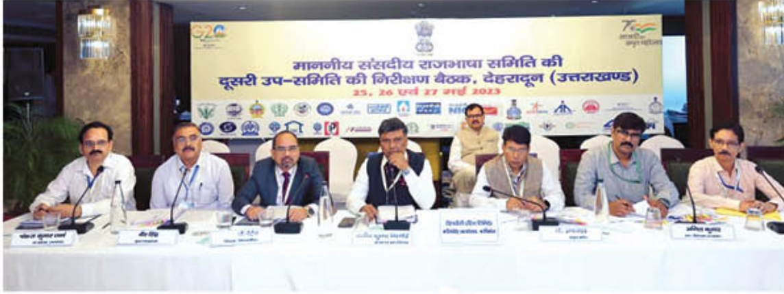
कारपोरेट कार्यालय, ऋषिकेश की समीक्षा का दृश्य