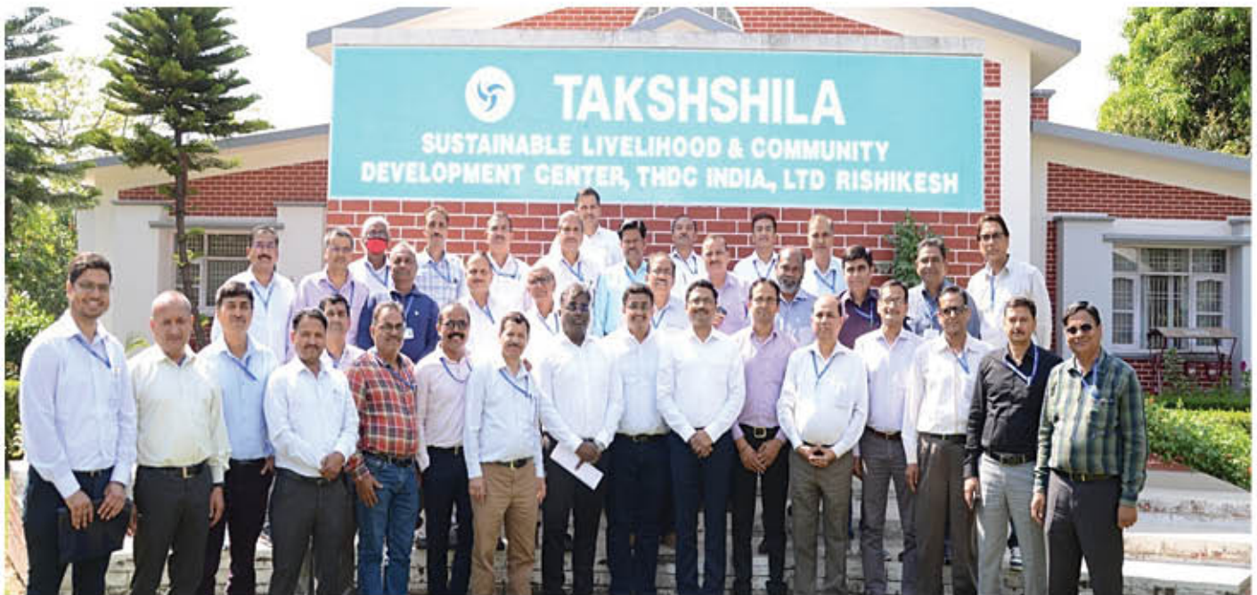
A group photograph of participants

A Capability Development Programme was organized for Executives in E-6 & E-7 level who are due for elevation to next level in DPC – 2023 through ASCI, Hyderabad from 10 th to 12 th April '2023 at HRD Centre, Rishikesh. The programme was conducted in Hybrid Mode. Total 112 participants attended the programme.