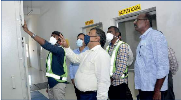
Glimpses of Chairman and Managing Director's visit to 50 MW Solar Power Project, Kasaragod, Kerala