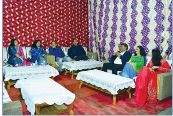
कॉरपोरेट कार्यालय में आयोजित दीपावली मेले का दृश्य