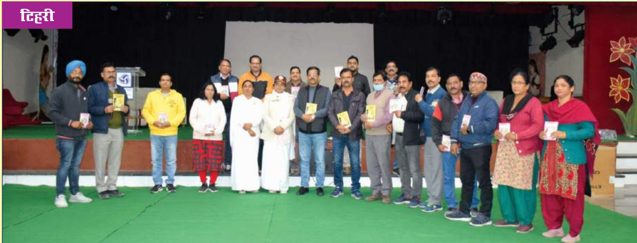
‘तनाव मुक्त’ विषय पर आयोजित कार्यशाला के दौरान ग्रुप फोटोग्राफ