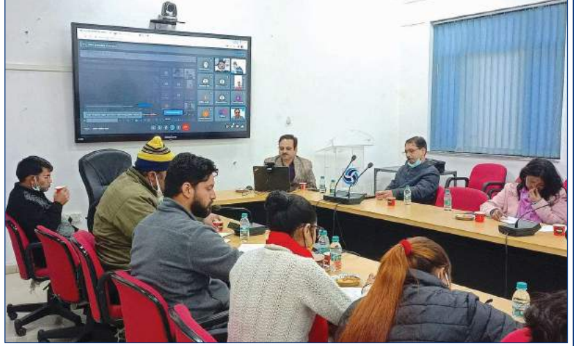
हिंदी कार्यशाला के आयोजन का दृश्य