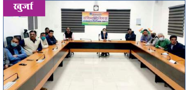
संविधान दिवस के अवसर पर खुर्जा परियोजना के कार्मिकों द्वारा शपथ ग्रहण का दृश्य