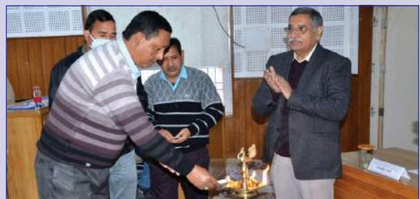
A view of inauguration ceremony of the training programme

A training programme on “Ethics & Values” for Workers/Non-executives was organized on 09.12.2021 at Centre for Sustainable Livelihood & Community Development, Rishikesh.