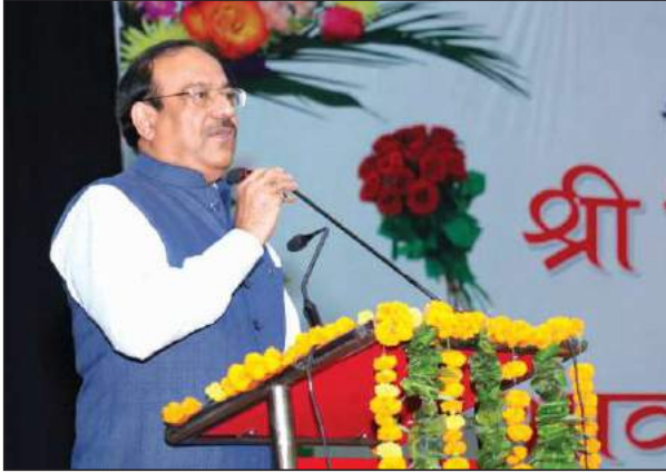
खुर्जा में आयोजित कार्यक्रम का दृश्य