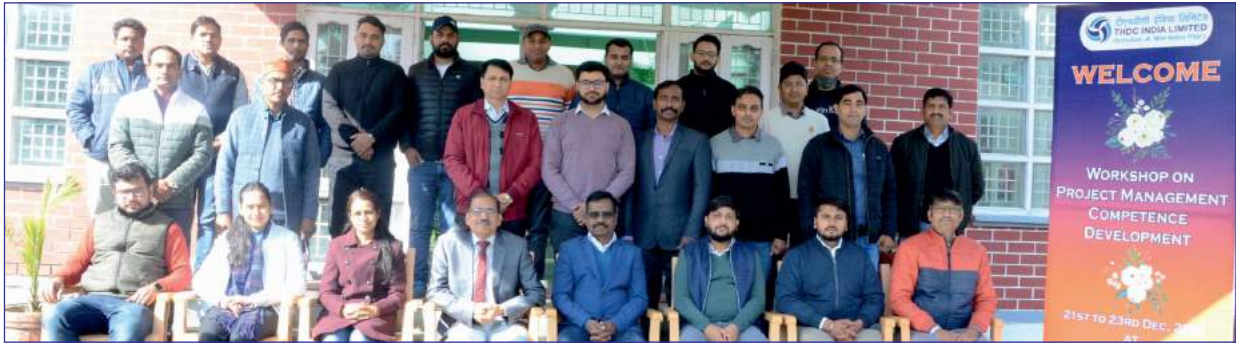
A view of the training programme