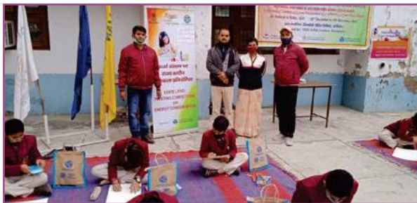
डी.डी.एम. डी.ए.वी. काशीपुर में आयोजित चित्रकला प्रतियोगिता की एक झलक