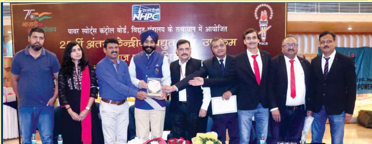
THDC India Limited stood Second Runners up in 25th Inter CPSU Bridge Tournament at Chandigarh organized by NHPC Limited under the aegis of Power Sports Control Board, Ministry of Power, Government of India.