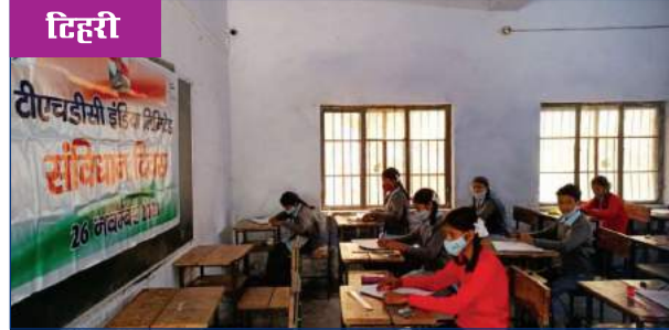
संविधान दिवस के अवसर पर स्कूली बच्चों के लिए निबंध लेखन एवं चित्रकला प्रतियोगिता के आयोजन का दृश्य