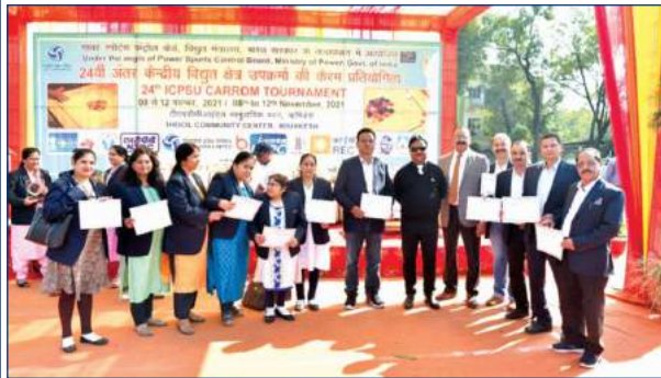
मुख्य अतिथि के साथ टीएचडीसी की महिला व पुरुष कैरम टीम का ग्रुप फोटोग्राफ