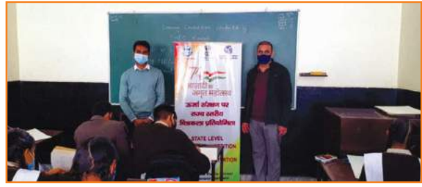
शिवालिक भागीरथी पब्लिक स्कूल, ऋषिकेश में आयोजित चित्रकला प्रतियोगिता का दृश्य