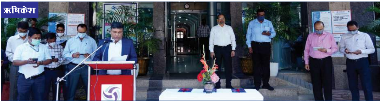
सतर्कता जागरूकता सप्ताह के शुभारंभ के दौरान शपथ ग्रहण का दृश्य