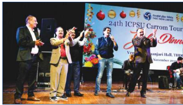
गाला डिनर के आयोजन का दृश्य