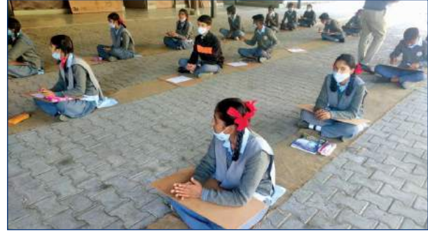
‘आज़ादी का अमृत महोत्सव’ के अंतर्गत आयोजित रंगोली एवं निबंध लेखन प्रतियोगिता की कुछ झलकियाँ