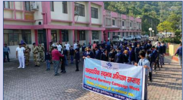
कोटेश्वर परियोजना पर 19.11.2021 से 25.11.2021 तक आयोजित राष्ट्रीय सांप्रदायिक सद्भाव अभियान सप्ताह के आयोजन के दृश्य