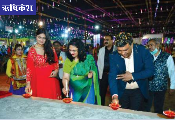
अध्यक्ष एवं प्रबंध निदेशक दीप प्रज्वलित कर दीपावली मेले का शुभारंभ करते हुए