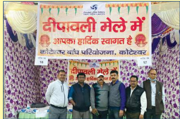
दीपावली मेले के दौरान कोटेश्वर परियोजना की प्रतिभागिता का दृश्य