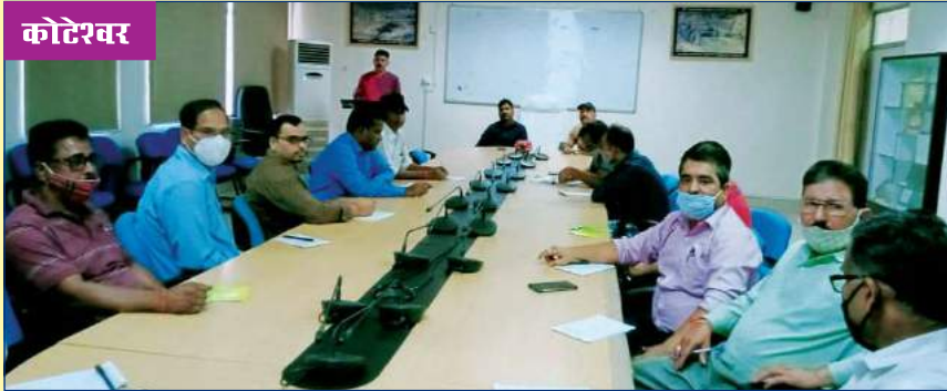
‘प्रबंधन में श्रमिकों की भागीदारी’ पर आयोजित कार्यशाला का दृश्य