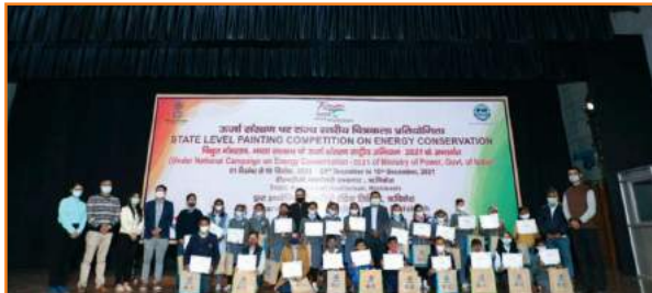
ऋषिकेश में आयोजित चित्रकला प्रतियोगिता के प्रतिभागी तथा आयोजक