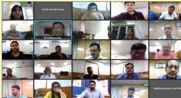
A screenshot during the training programme organized through virtual mode

A 03-day training programme on “ISO 9001:2015 QMS, ISO 14001:2015 EMS & ISO 45001:2018 OH&SMS - Effective Implementation & Internal Auditor Training” was organized through online mode for the executives of E-2 to E-6 level from various disciplines through Engineering Staff College of India, Hyderabad from 15.11.2021 to 17.11.2021.