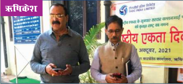
राष्ट्रीय एकता दिवस के अवसर पर शपथ ग्रहण का दृश्य