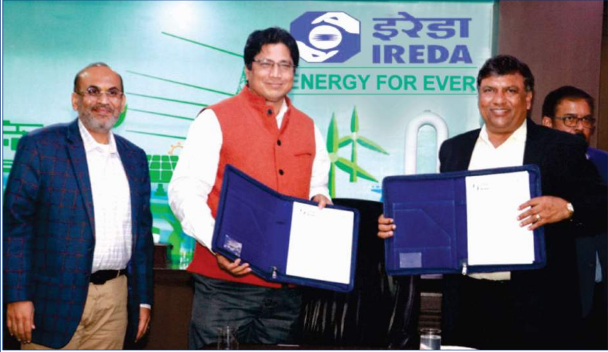
टीएचडीसी इंडिया लिमिटेड और इरेडा के मध्य समझौता ज्ञापन पर हस्ताक्षर के दृश्य

टीएचडीसी इंडिया लिमिटेड ने हरित ऊर्जा सहयोग के लिए भारतीय अक्षय ऊर्जा विकास संस्था लिमिटेड (इरेडा) के साथ 03 दिसम्बर, 2021 को नई दिल्ली में एक समझौता ज्ञापन पर हस्ताक्षर किए।