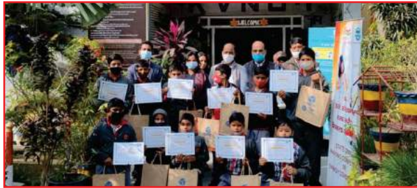
केन्द्रीय विद्यालय, रुड़की में आयोजित चित्रकला प्रतियोगिता की एक झलक