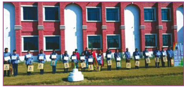
इरा इन्टरनेशनल स्कूल, बहादुराबाद में आयोजित चित्रकला प्रतियोगिता की एक झलक