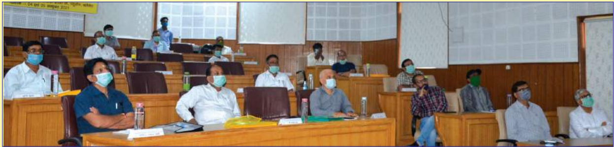
A view of the training programme