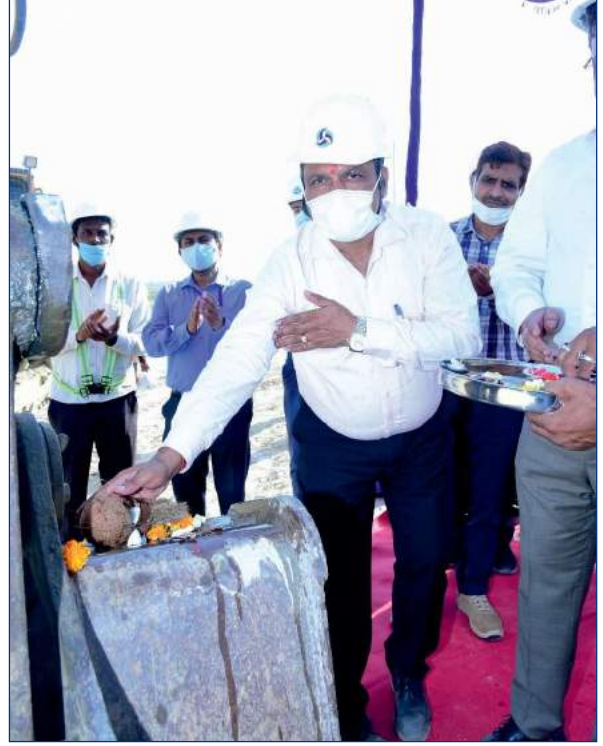
कोयला हैंडलिंग प्लांट के भूमि पूजन के दृश्य

उल्लेखनीय है कि माननीय प्रधानमंत्री श्री नरेन्द्र मोदी जी ने मार्च, 2019 में इस परियोजना का शिलान्यास कर, इसके निर्माण कार्य को हरी झंडी दी थी। उत्तर प्रदेश के बुलंदशहर जिले के अंतर्गत स्थित खुर्जा एसटीपीपी की कुल संस्थापित क्षमता 1320 मेगावाट है जिसमें 660 मेगावाट की दो यूनिटों का प्रावधान हैं। परियोजना के सभी प्रमुख पैकेज अवार्ड कर निर्माण कार्य आरम्भ हो गया है। कोयला मंत्रालय, भारत सरकार द्वारा 17 जनवरी, 2017 को इस परियोजना में ईंधन की आपूर्ति के लिए टीएचडीसी को मध्य प्रदेश के सिंगरौली में स्थित अमेलिया कोयला खदान आबंटित की जा चुकी है। अमेलिया कोयला खदान से कोयला देवराग्राम रेलवे स्टेशन से 840 किमी. की दूरी पर खुर्जा के डांवर रेलवे स्टेशन लाया जाएगा। डांवर रेलवे स्टेशन से परियोजना स्थल तक कोयला पहुंचाने के लिए टीएचडीसी द्वारा 16 किमी. लंबी निजी रेलवे साइडिंग का निर्माण किया जा रहा है। परियोजना स्थल पर कोयले के परिष्कृत करने का कार्य कोयला हैंडलिंग प्लांट में किया जाएगा। उत्तर भारत की विद्युत आवश्यकताओं की पूर्ति के लिए खुर्जा उच्च ताप विद्युत परियोजना मील का पत्थर साबित होगी। राष्ट्रीय राजधानी क्षेत्र में स्थित होने के कारण इस परियोजना से भविष्य में पड़ोसी राज्यों की ऊर्जा आवश्यकताएं भी पूरी होंगी। परियोजना की पहली यूनिट फरवरी, 2024 में कमीशन करने का लक्ष्य रखा गया है।