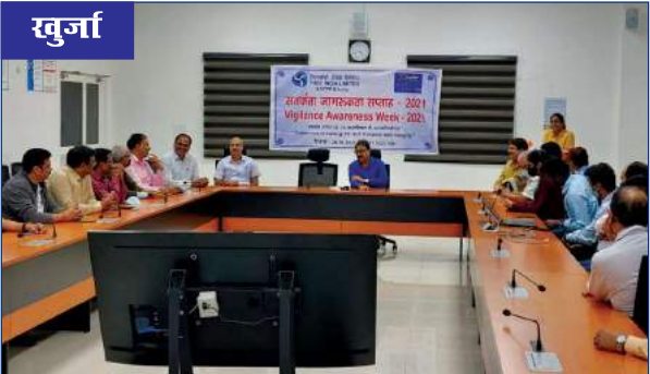
केएसटीपीपी में आयोजित सतर्कता जागरूकता सप्ताह का दृश्य