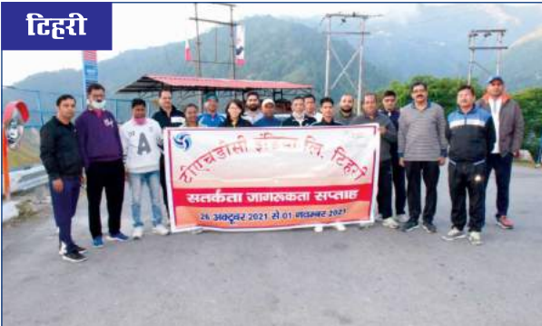
टिहरी में सतर्कता जागरूकता सप्ताह के आयोजन का दृश्य