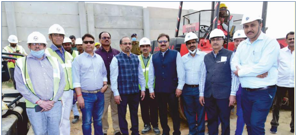
A view of inauguration ceremony

After the site visit, Director (Finance) held a meeting with all the executives of the project, where he addressed various queries of the employees. He also gave insights about the financial health of the organization and the progress made by the company so far.