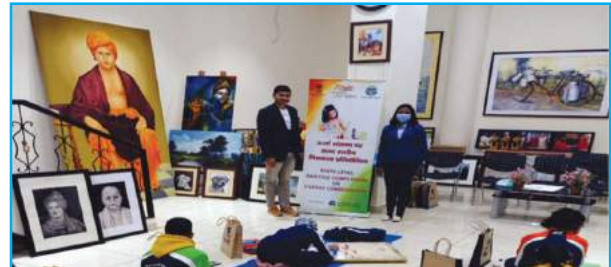
आचार्यकुलम, हरिद्वार में चित्रकला प्रतियोगिता की एक झलक