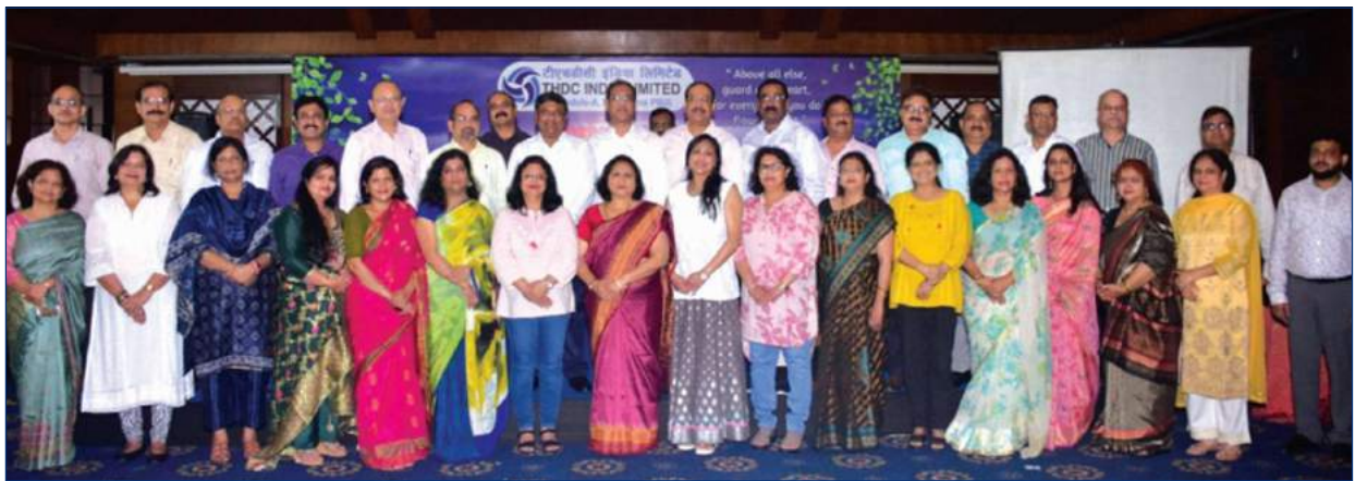
A group photograph during the workshop