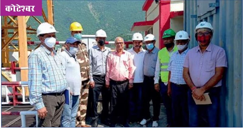
डेमो कार्यक्रम का दृश्य