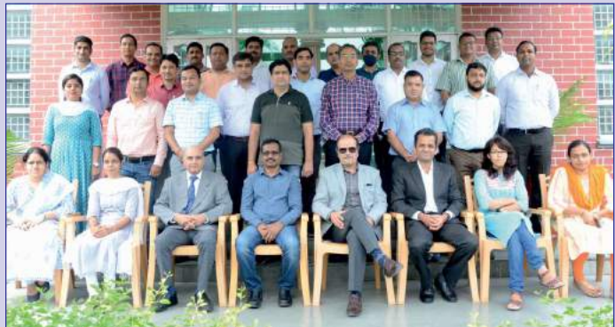
A group photograph during the training programme

A 03-day training programme from 22.09.2021 to 24.09.2021 was organized on “Management Development Programme on Industry 4.0” for E-4 to E-6 executives through PHD Chamber of Commerce & Industry, Uttarakhand State Chamber at Centre for Sustainable Livelihood & Community Development, Rishikesh. The training programme was attended by 28 executives.