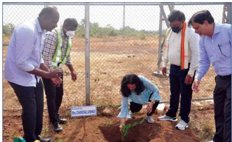
A view of plantation programme

Chairman and Managing Director appreciated the ongoing activities of the Project and gave his valuable suggestions for the further improvements. He also expressed that THDCIL is also exploring possibilities of development of Pumped Storage Projects and Renewable energy schemes in the state of Kerala.