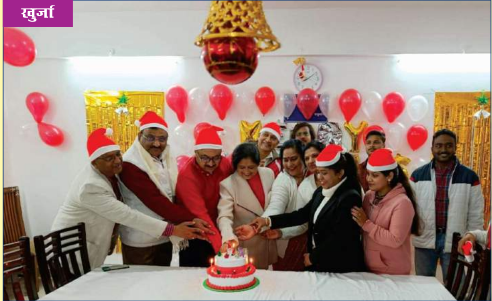
क्रिसमस पर्व के आयोजन का दृश्य