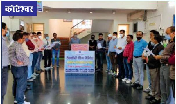
कोटेश्वर परियोजना में सतर्कता जागरूकता सप्ताह के अवसर पर शपथ ग्रहण का दृश्य