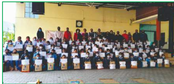
टी. ई. एस. हाई स्कूल, ऋषिकेश में आयोजित चित्रकला प्रतियोगिता का दृश्य