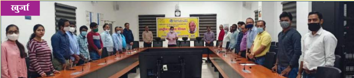
राष्ट्रीय एकता दिवस के आयोजन का दृश्य