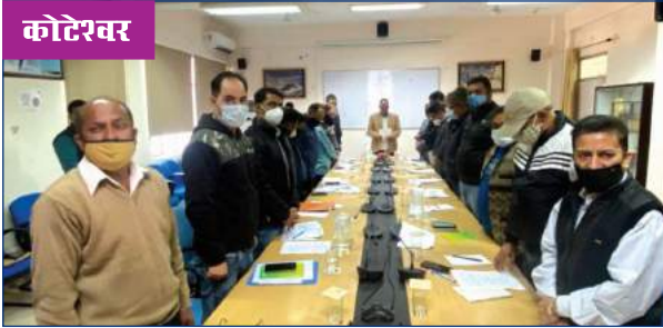
संविधान दिवस के अवसर पर शपथ ग्रहण का दृश्य