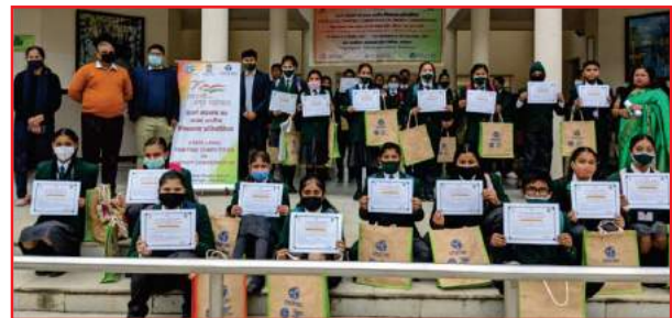
दिल्ली पब्लिक स्कूल, रानीपुर हरिद्वार में आयोजित चित्रकला प्रतियोगिता की एक झलक