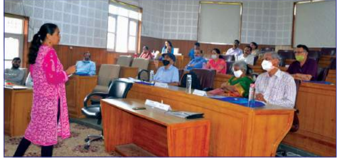
A view of the workshop

A 04-day workshop organized on “Recreating Systems to a Happy Life Style” for the DGMs from various disciplines along with their spouses in two batches from 07.09.2021 to 10.09.2021 at Centre for Sustainable Livelihood & Community Development, Rishikesh through GoGhumantu. The workshop was attended by 27 executives along with their spouses.