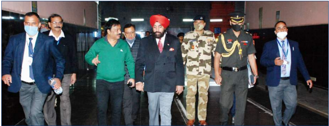
उत्तराखंड के महामहिम राज्यपाल, लेफ्टिनेंट जनरल (सेवानिवृत्त) श्री गुरमीत सिंह के टिहरी दौरे की कुछ झलकियाँ