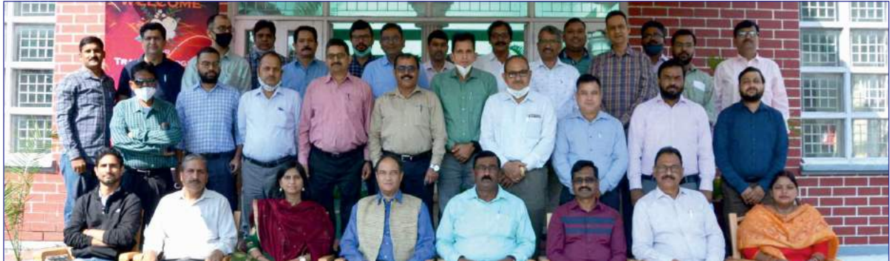
A view of the training programme