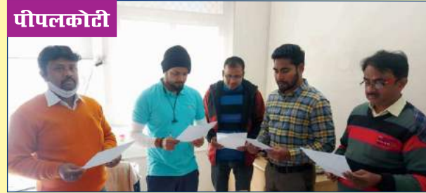
राष्ट्रीय एकता दिवस के अवसर पर शपथ ग्रहण का दृश्य