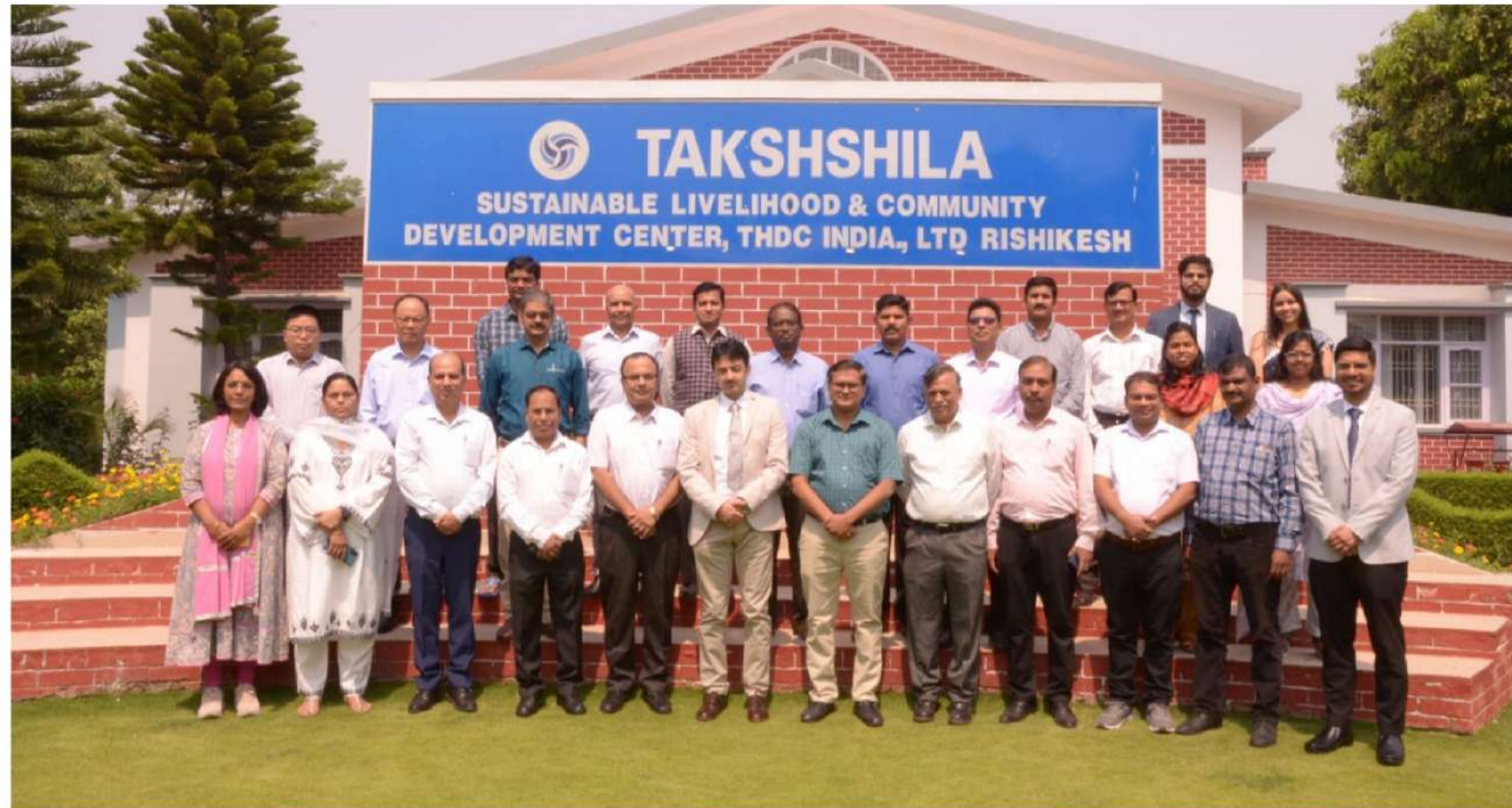
A group photograph during the program

A comprehensive 05-day mid-career training program for the 2nd Batch of Chief Engineers of the Central Electricity Authority (CEA) was inaugurated at the HRD Centre, THDC India Limited in Rishikesh on 06th May, 2024. Organized from 6th May to 10th May, 2024 this training program signified a significant stride towards enhancing leadership skills and embracing emerging technologies in the Power Sector.