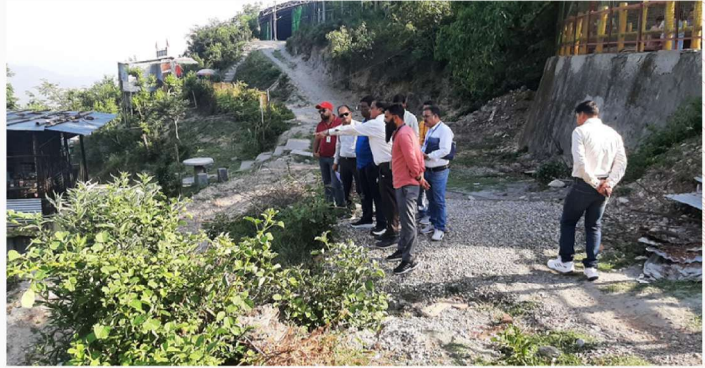
Some views of the visit