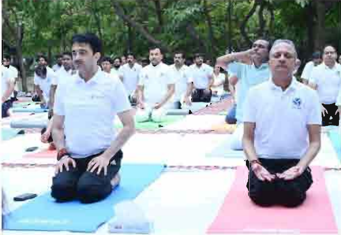
एनसीआर कार्यालय में योग दिवस के आयोजन के दृश्य

टीएचडीसी इंडिया लिमिटेड ने अपने कॉर्पोरेट कार्यालय, के साथ-साथ सभी परियोजना और यूनिट कार्यालयों में 10वां अंतरराष्ट्रीय योग दिवस मनाया। इस वर्ष के लिए योग दिवस की थीम "स्वयं और समाज के लिए योग" रखी गई थी। इस कार्यक्रम में सभी परियोजनाओं और कार्यालयों में कार्यरत कर्मचारियों ने एकजुट होकर स्वास्थ्य और कल्याण को बढ़ावा देने के लिए उत्साह और जोश की भावना के साथ इस योग कार्यक्रम में भाग लिया।