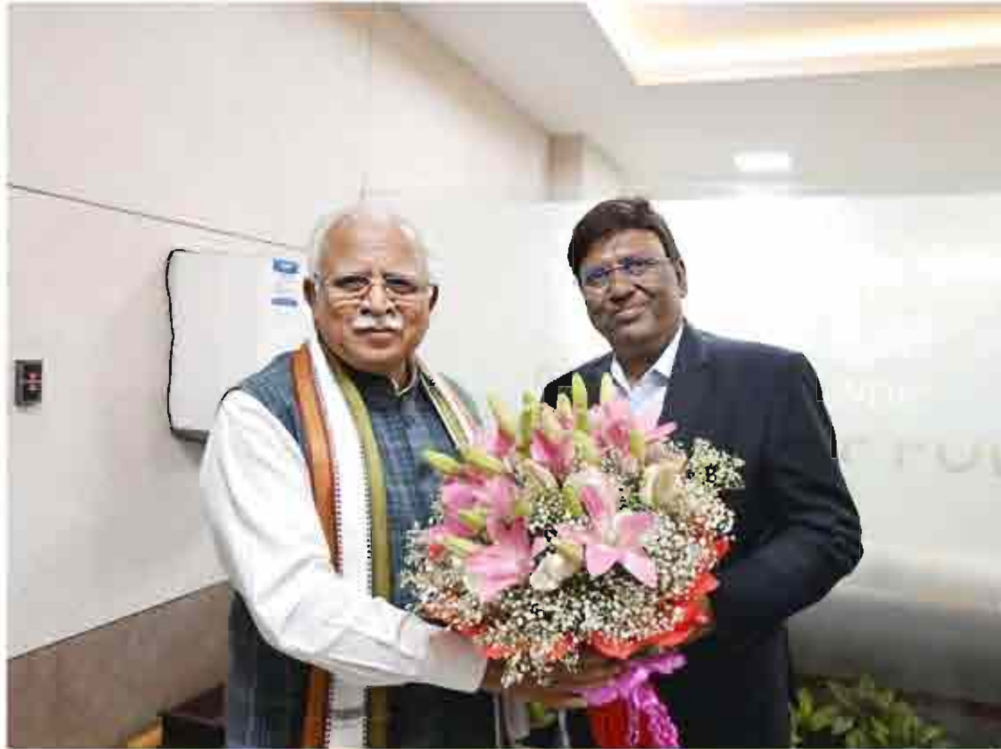
Courtesy call by CMD, THDCIL, Sh. R. K. Vishnoi, on the Hon'ble Minister of Power and Housing & Urban Affairs, Sh. Manohar Lal, in New Delhi on 10th June, 2024.