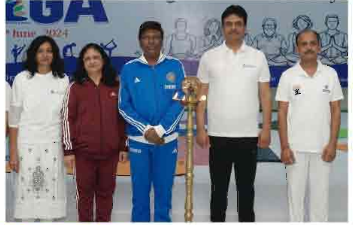
कॉर्पोरेट कार्यालय में योग दिवस के आयोजन के दृश्य