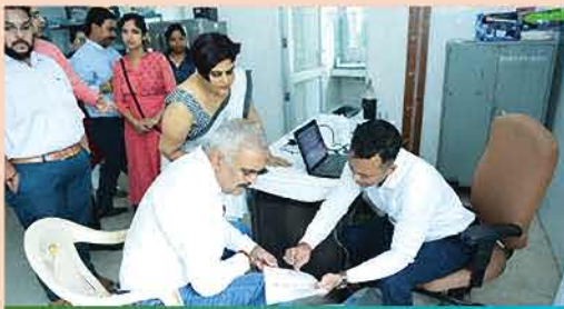
निरामय स्वास्थ्य केंद्र द्वारा आयोजित मल्टी स्पेशलिटी कैंप के आयोजन का दृश्य