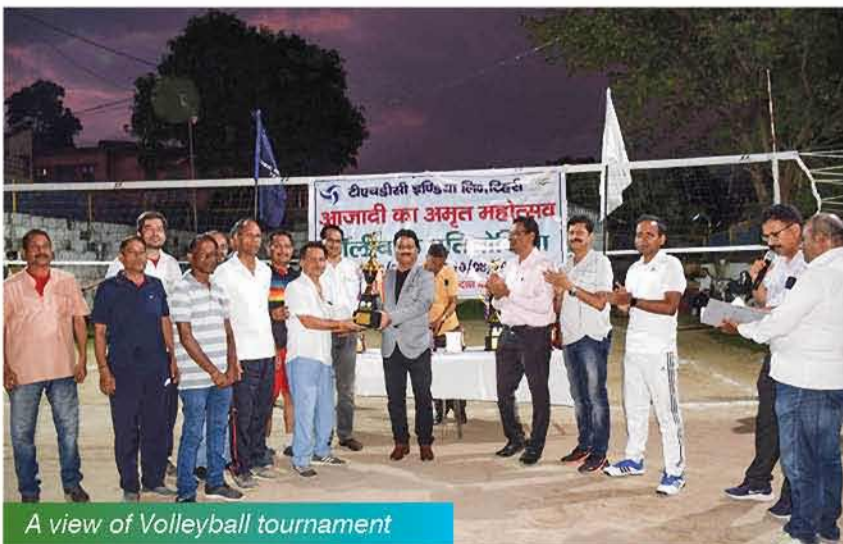
A view of Volleyball tournament