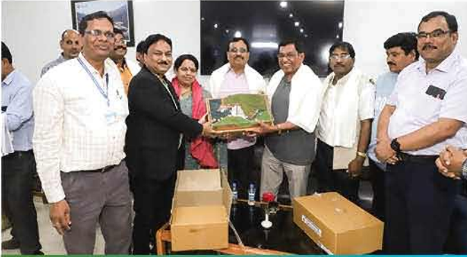
अनुसूचित जाति एवं अनुसूचित जनजाति संसदीय समिति के माननीय सदस्यों के टिहरी बाँध के दौरे का दृश्य

अनुसूचित जाति एवं अनुसूचित जनजाति संसदीय समिति के माननीय सदस्यों के द्वारा 19 अगस्त 2022 को टिहरी बाँध परियोजना का दौरा किया गया। संसदीय समिति के सदस्यों का टिहरी परियोजना के अतिथि गृह, भागीरथीपुरम् पहुँचने पर माननीय विधायक, टिहरी