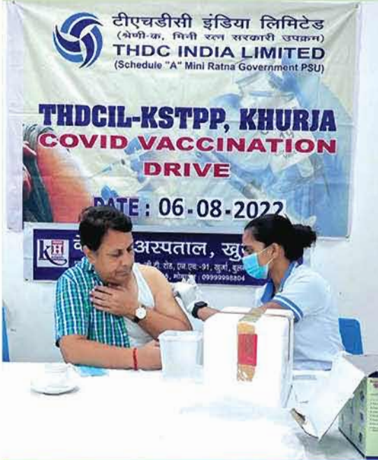
कोविड-19 बूस्टर डोज़ कैम्प के आयोजन का दृश्य

खुर्जा उच्च ताप विद्युत परियोजना में 6 अगस्त, 2022 को कोविड-19 की द्वितीय चरण बूस्टर डोज़ कैम्प का आयोजन कैलाश अस्पताल के समन्वय से किया गया। उक्त कैम्प में 40 लोगों को बूस्टर डोज़ लगाई गई।