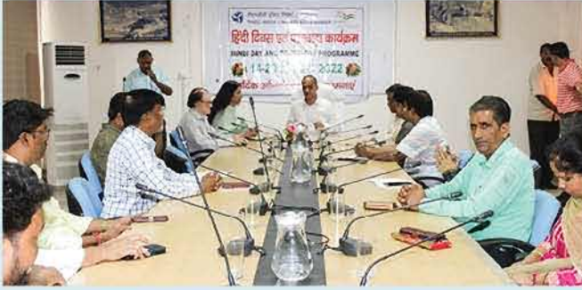
कोटेश्वर परियोजना में हिंदी पखवाड़ा के आयोजन का दृश्य