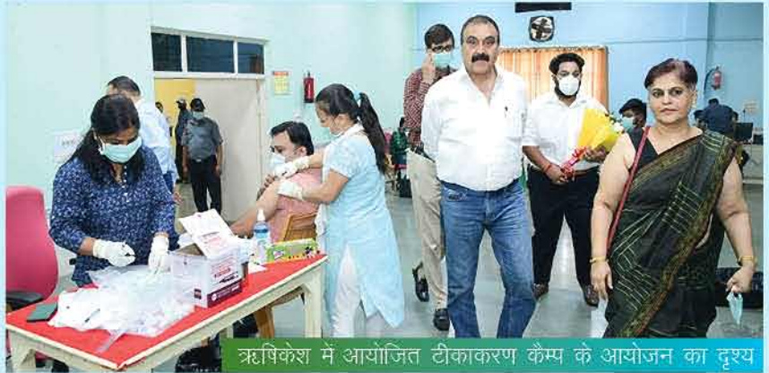
ऋषिकेश में आयोजित टीकाकरण कैंप के आयोजन का दृश्य

कॉरपोरेट कार्यालय, ऋषिकेश में एक दिवसीय कोविड-19 टीकाकरण कैंप (प्रीकॉशन डोज़ की थर्ड डोज़) का आयोजन 09 अगस्त 2022 को किया गया। उक्त टीकाकरण कैंप कॉरपोरेशन में कार्यरत सभी अधिकारियों, कर्मचारियों, संविदा पर कार्यरत कर्मचारियों एवं उनके आश्रितों हेतु आयोजित किया गया।