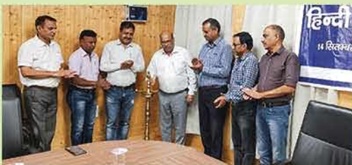
हिंदी पखवाड़ा सप्ताह के शुभारंभ का दृश्य