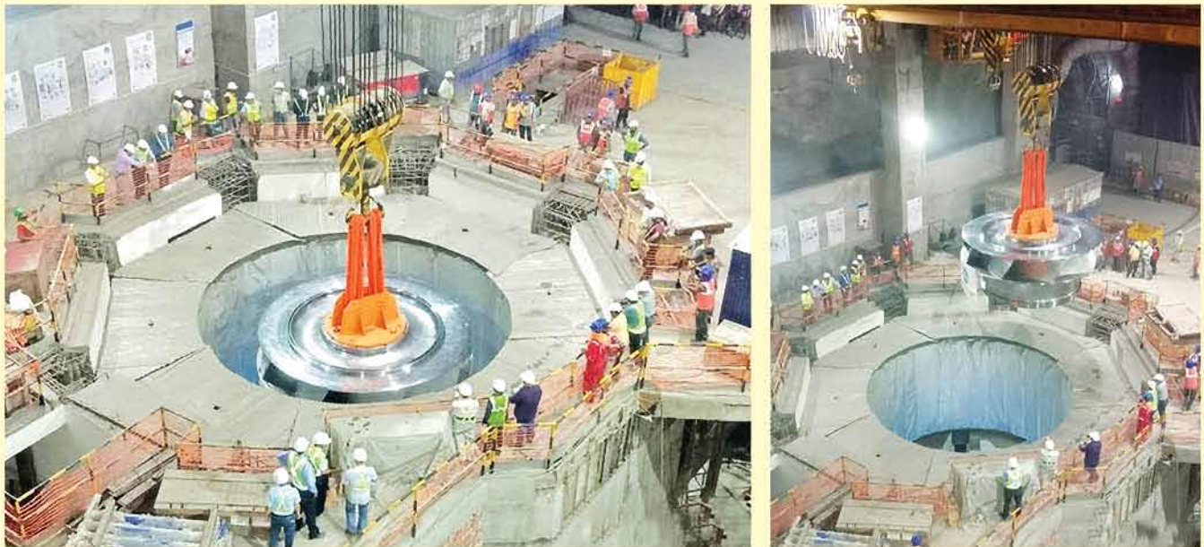
Glimpses of the erection of the first unit of 250 MW of Tehri PSP