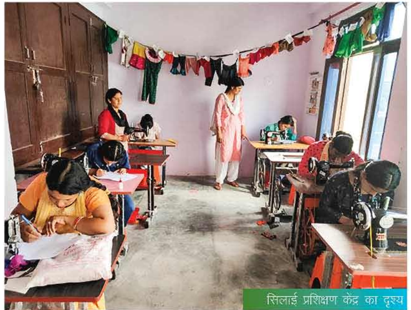
सिलाई प्रशिक्षण केंद्र का दृश्य

उपरोक्त प्रशिक्षण केंद्र में मात्र 50 रुपए प्रतिमाह के मामूली शुल्क का भुगतान करके छह महीनों का सिलाई प्रशिक्षण प्राप्त कर दूरदराज एवं परियोजना प्रभावित गांव की महिलाएं आत्मनिर्भरता की ओर बढ़ रही हैं और सिलाई का काम करते हुए अपने परिवार की आय में भी सफल रूप से योगदान दे पा रही हैं।