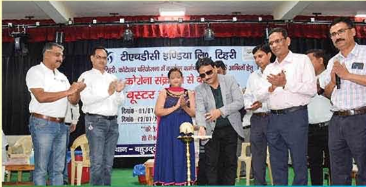
टिहरी परियोजना में आयोजित बूस्टर डोज़ शिविर का दृश्य