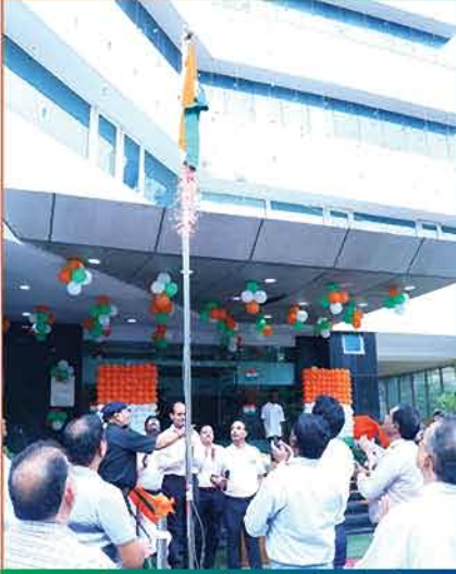
एनसीआर कार्यालय, कौशांबी में स्वतंत्रता दिवस के सुअवसर पर ध्वजारोहण का दृश्य