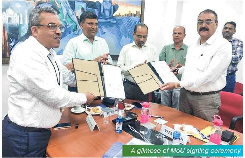
A glimpse of MoU signing ceremony

THDC India Limited inked an MoU with NTPC School of Business (NSB) on 21st July, 2022 for enhancing the competencies and skill sets of THDCIL employees by undertaking various capacity-building initiatives with a special focus on broad techno-managerial domains. NSB is an Institute having a qualified multi-disciplinary team of academicians, and researchers which imparts education and carries out research and teaching in the field of energy management through AICTE-approved programmes. NSB