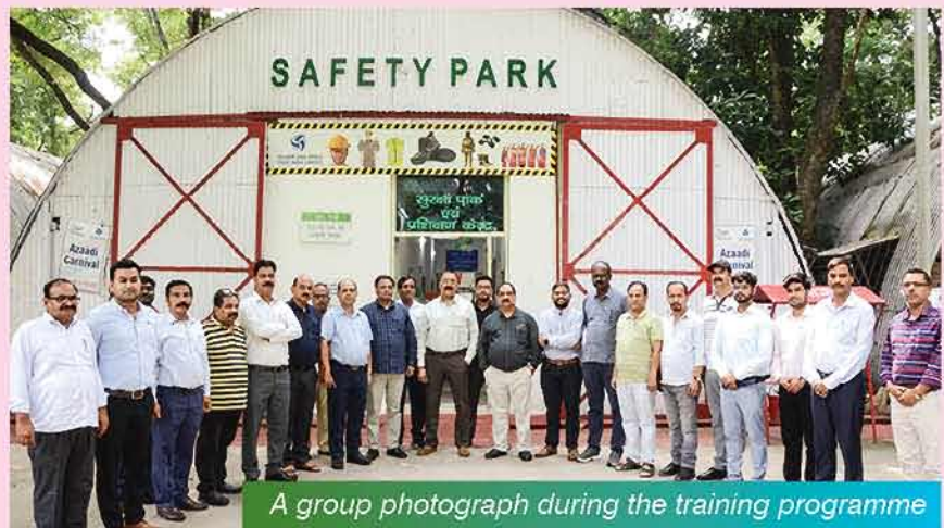
A group photograph during the training programme