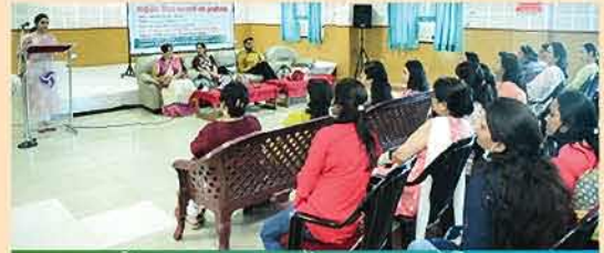
निरामय स्वास्थ्य केंद्र द्वारा आयोजित Dermatology Talk Session का दृश्य