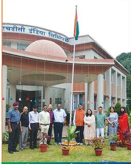
देहरादून कार्यालय में 76वें स्वतंत्रता दिवस के आयोजन का दृश्य