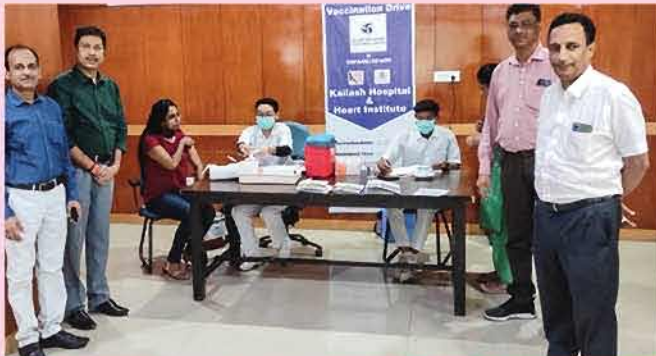
एनसीआर कार्यालय कोविड-19 बूस्टर डोज़ शिविर के आयोजन का दृश्य

एनसीआर कार्यालय में 17 अगस्त, 2022 को कोविड-19 बूस्टर डोज़ शिविर का आयोजन कैलाश अस्पताल, नोएडा के समन्वय से किया गया। उक्त शिविर में कार्यालय में कार्यरत सभी अधिकारियों, कर्मचारियों व संविदा पर कार्यरत कर्मचारियों व उनके आश्रितों को बूस्टर डोज़ लगाई गई।