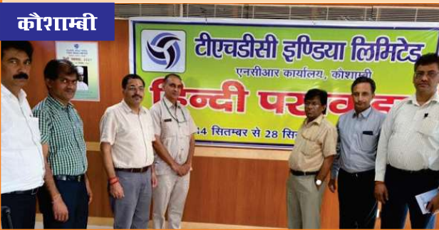
एनसीआर कार्यालय में आयोजित हिन्दी पखवाड़ा कार्यक्रम के दृश्य