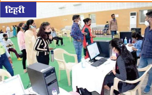
टिहरी में आयोजित कोरोना- टीकाकरण अभियान का दृश्य

टीएचडीसी द्वारा मुख्य चिकित्साधिकारी टिहरी, गढ़वाल के सहयोग से 17.09.2021 को टीएचडीसी के बहुउद्देशीय भवन भागीरथीपुरम में 18 वर्ष से अधिक आयु के व्यक्तियों हेतु कोरोना टीकाकरण कैंप का आयोजन किया गया। इस कोरोना टीकाकरण कैंप में 100 लोगों द्वारा प्रथम खुराक एवं 365 लोगों के द्वारा द्वितीय खुराक का लाभ उठाया गया। कैंप में टीएचडीसी के कर्मियों एवं उनके परिवार के सदस्यों, संविदाकर्मियों एवं सी. आई.एस.एफ कर्मियों व उनके आश्रितों तथा आस-पास के ग्रामीणों द्वारा टीकाकरण का लाभ उठाया गया।