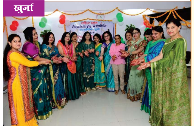
महिला क्लब द्वारा आयोजित हरियाली तीज महोत्सव की कुछ झलकियाँ