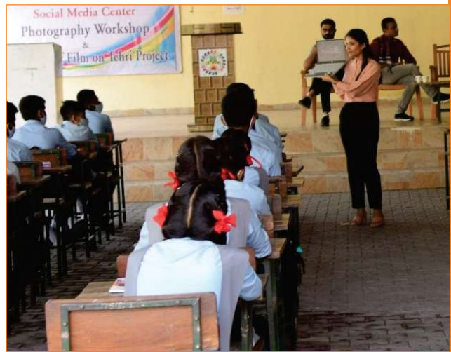
A view of photography workshop at TES High School, Rishikesh