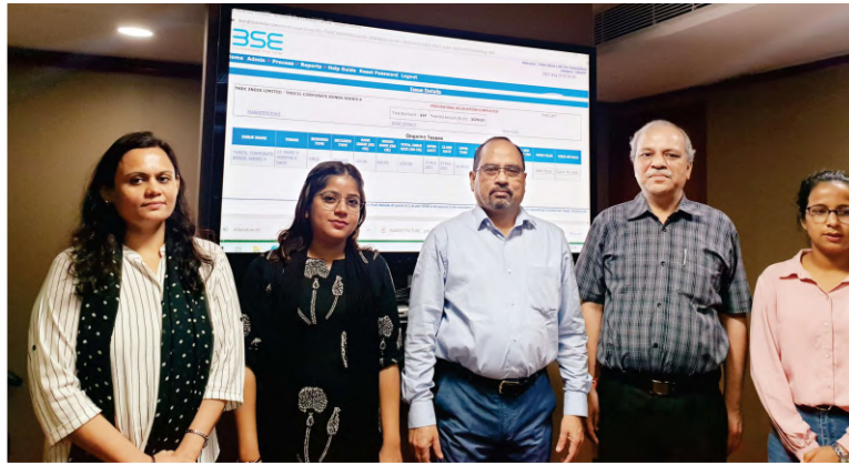
A view of the bidding process at THDCIL's NCR office

THDC India Limited has successfully raised Corporate Bonds of ₹1200 Cr. @ 7.39% from debt market through E-Bidding with 9 times over subscription