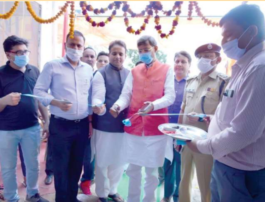
ऑक्सीजन प्लांट के उद्घाटन का दृश्य

कोविड-19 वैश्विक महामारी के दौरान ऑक्सीजन की कमी के दृष्टिगत जिलाधिकारी, बुलंदशहर के आदेशानुसार टीएचडीसी द्वारा कॉरपोरेट सामाजिक उत्तरदायित्व के अंतर्गत वीआईआईटी हॉस्पिटल एवं कॉलेज, बुलंदशहर में 500 एलपीएम मेडिकल ऑक्सीजन प्लांट स्थापित कराया गया।