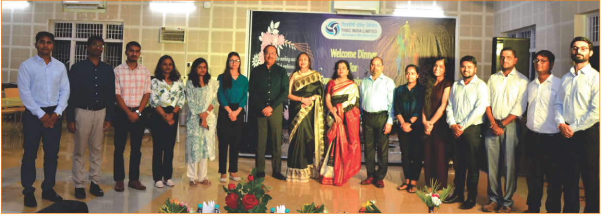
A view of training session

HRD, Rishikesh organized an orientation training programme for the newly inducted Executive trainees in the discipline of 'Human Resource' and 'Public Relations' batch-2021. The training programme was scheduled from 16 th - 24 th September 2021 at the Campus of Sustainable Livelihood and Community Development Centre (SLCDC) (HRD Centre), Aam Bagh, Rishikesh. During the 9-day training programme the Executive trainees were briefed about various departments including the policies, employee benefits, CDA rules, IT infrastructure etc. related to the organization. The training programme also included a 2-day outbound module.