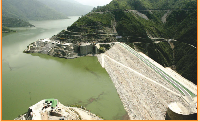
टिहरी झील का दृश्य

टिहरी बांध परियोजना के इतिहास में 24 सितंबर, 2021 उल्लेखनीय दिन साबित हुआ, जब टिहरी जलाशय में जल पहली बार 830 मीटर के पूर्ण जलाशय स्तर (FRL) तक पहुँचा। यद्यपि यह परियोजना पिछले 15 वर्षों से लगातार 1000 मेगावाट की पीकिंग पावर के साथ-साथ पेयजल एवं सिंचाई के लिए जल, बाढ़ नियंत्रण, मछली पालन, पर्यटन इत्यादि जैसे अन्य लाभ प्रदान कर रही है परन्तु फिर भी इसकी पूर्ण क्षमता का उपयोग नहीं किया जा सका क्योंकि टिहरी जलाशय का स्तर पूर्ण जलाशय स्तर (एफआरएल), EL 830 मीटर तक भरने की अनुमति राज्य सरकार से लंबित थी। टीएचडीसी इंडिया लिमिटेड