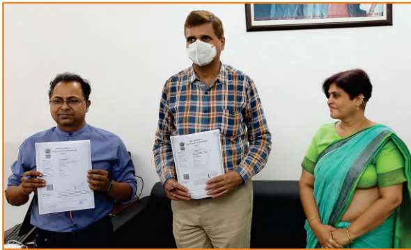
सेवा-टीएचडीसी एवं एम्स ऋषिकेश के मध्य स्वास्थ्य शिविर आयोजित करने हेतु समझौता ज्ञापन का दृश्य

सेवा-टीएचडीसी एवं अखिल भारतीय आयुर्विज्ञान संस्थान (एम्स), ऋषिकेश के मध्य 15.07.2021 को ऋषिकेश, टिहरी एवं हरिद्वार जनपद में मधुमेह एवं मधुमेह संबंधित हृदय विकारों के उपचार हेतु स्वास्थ्य शिविर आयोजित करने के लिए समझौता ज्ञापन पर हस्ताक्षर किए गए। उल्लेखनीय है कि टीएचडीसी अपने कॉरपोरेट सामाजिक उत्तरदायित्व के अन्तर्गत परियोजना प्रभावित क्षेत्रों में बेहतर स्वास्थ्य सेवाएं उपलब्ध कराने एवं सरकारी स्वास्थ्य व्यवस्था को अधिक सुगम्य बनाने हेतु प्रयासरत है। इसी क्रम में एक और नई सीएसआर परियोजना का शुभारंभ एम्स ऋषिकेश के साथ किया जा रहा है। इस परियोजना का मुख्य उद्देश्य, जनपद टिहरी एवं हरिद्वार में स्वास्थ्य शिविरों के माध्यम से मधुमेह पीड़ितों का निशुल्क उपचार, परामर्श व निशुल्क दवाईयाँ