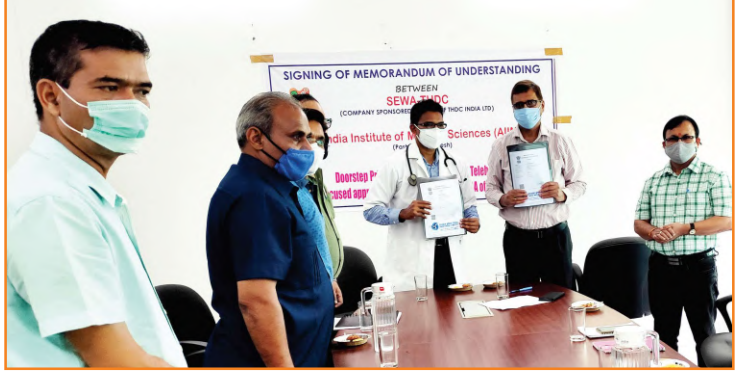
एम्स, ऋषिकेश एवं टीएचडीसी के मध्य मोबाइल हेल्थ वैन हेतु समझौता ज्ञापन पर हस्ताक्षर का दृश्य

सेवा-टीएचडीसी, ऋषिकेश और ऑल इंडिया इंस्टीट्यूट ऑफ मेडिकल साइंस (एम्स), ऋषिकेश के मध्य टिहरी जनपद में टेलीमेडिसिन आधारित मोबाइल हेल्थ वैन द्वारा स्वास्थ्य सेवाएं उपलब्ध करवाने हेतु समझौता ज्ञापन निष्पादित किया गया। टीएचडीसी इंडिया लिमिटेड अपने सामाजिक उत्तरदायित्व के अन्तर्गत परियोजना प्रभावित क्षेत्रों में बेहतर स्वास्थ्य सेवाएं उपलब्ध कराने एवं सरकारी स्वास्थ्य व्यवस्था के सुदृढीकरण हेतु प्रयासरत है। इसी क्रम में सीएसआर परियोजना का शुभारंभ एम्स, ऋषिकेश के साथ किया गया।