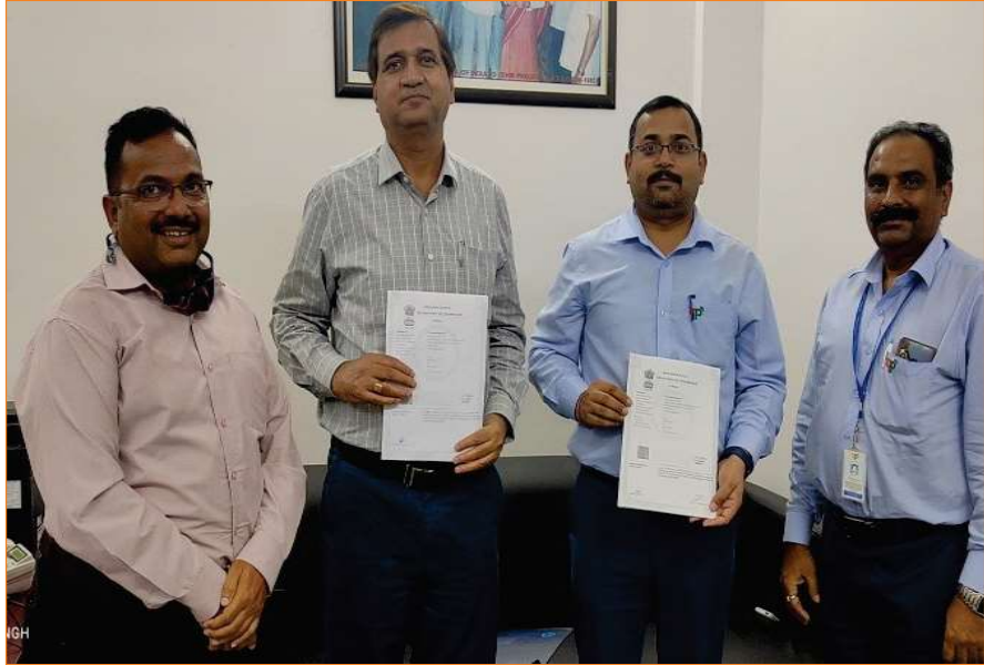
A view of MoU signing ceremony

A memorandum of understanding was signed between SEWA-THDC and Central Institute of Petrochemicals Engineering & Technology (CIPET) on 03.09.2021 for "Skill development training for aspiring youths from affected areas of Tehri & Koteshwar projects in Plastics Technology (Diploma)". The course will commence from the academic year 2021-22 for a period of three years. The agreement was signed by Sh. P.K.