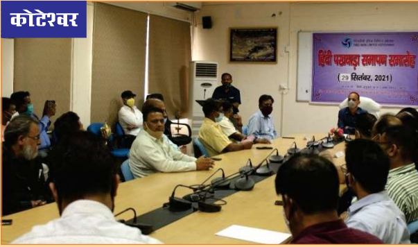
कोटेश्वर परियोजना में हिन्दी पखवाड़ा के अवसर पर आयोजित कार्यक्रम के दृश्य