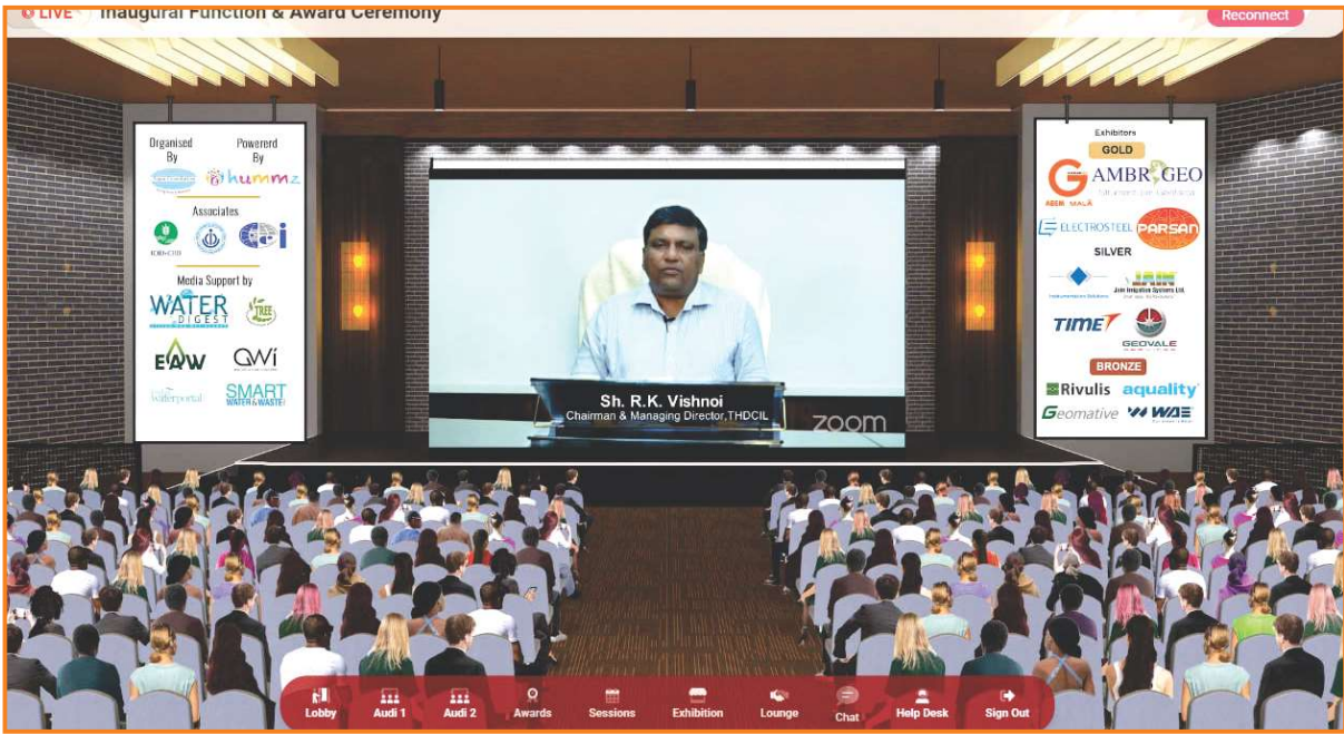
THDC being awarded "Dam Safety Project of the year" award at XV World Aqua Congress & International Dam Safety Conclave 2021

Tehri Dam Project (1000MW) of THDC India limited has been conferred with 'Dam Safety Project of the Year' award during XV World Aqua Congress & International Dam Safety Conclave 2021. Adding another milestone of achievement in its long feat of success, Tehri dam has been proving to be a remarkable success in the engineering marvels of the country.