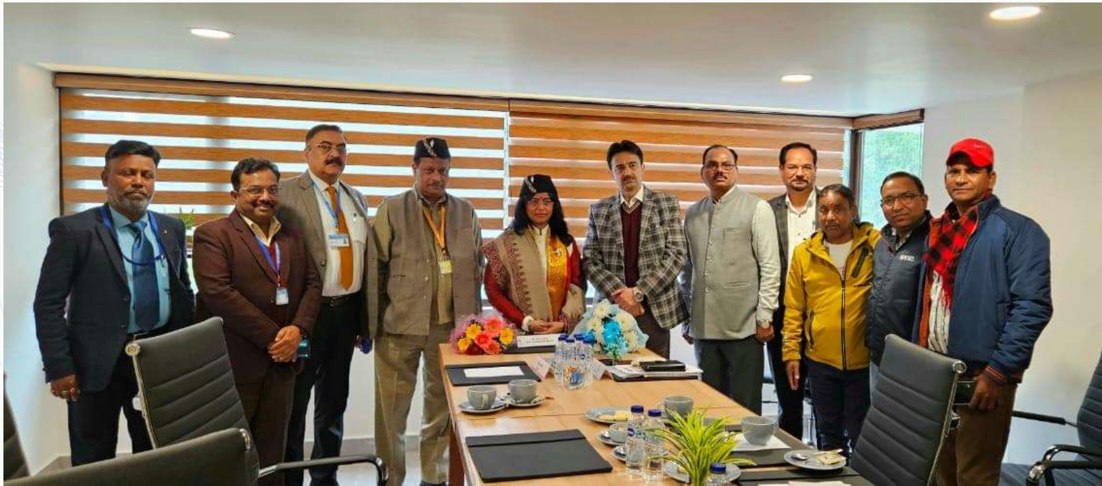
A group photograph during the review meeting

Dr. Anju Bala, Hon'ble member of the National Commission for SC, Government of India, visited Dehradun on December 30, 2023, to review the implementation of the Reservation Policy at different Government departments and Establishments of Uttarakhand.