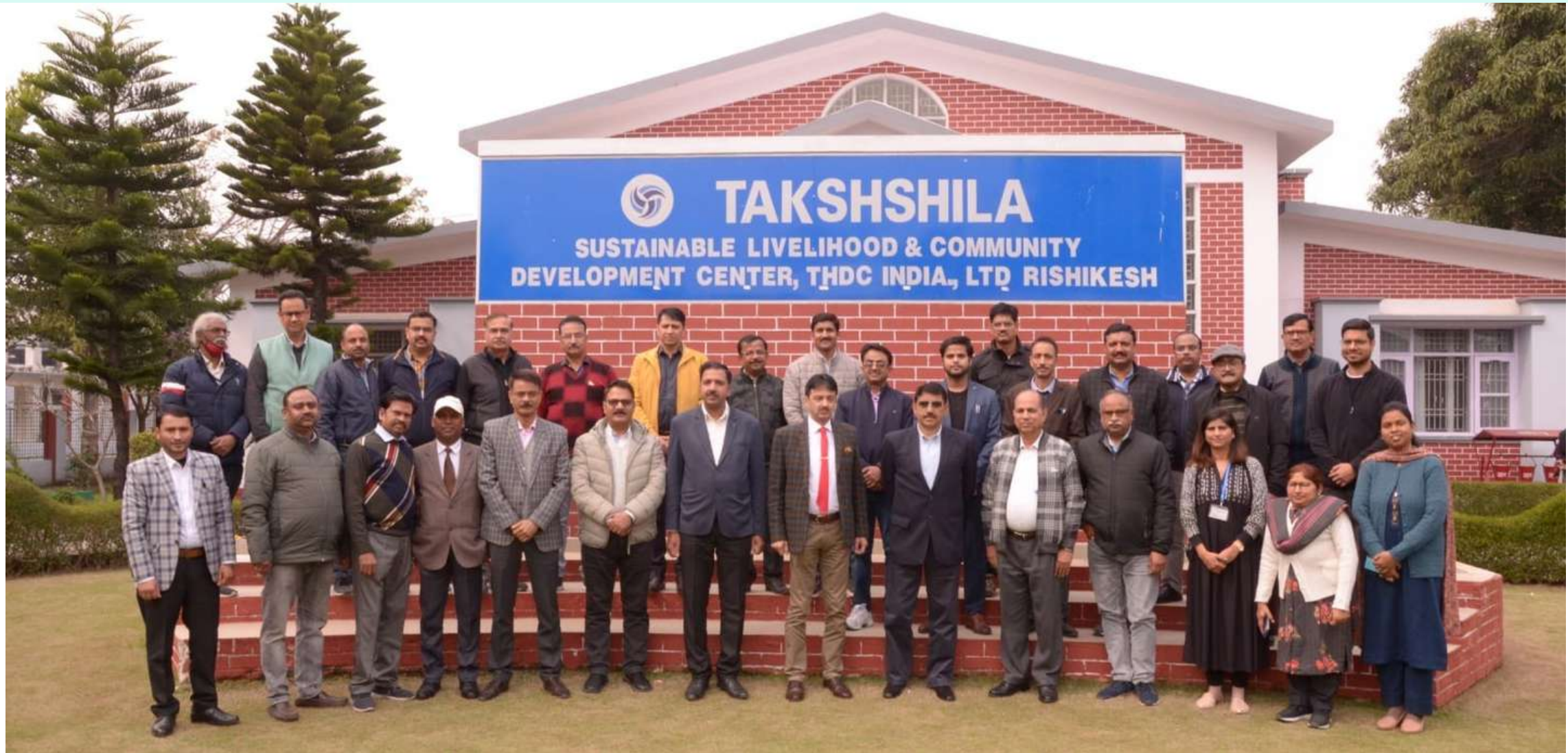
A group photogram during the program

An Advocacy program organized under the Competition Commission of India