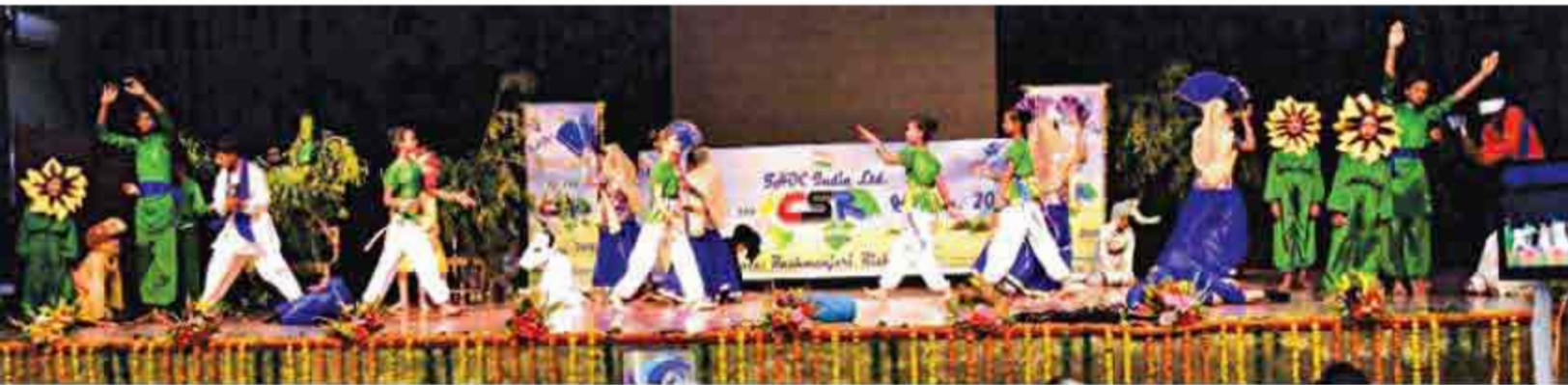
सांस्कृतिक कार्यक्रमों की एक झलक