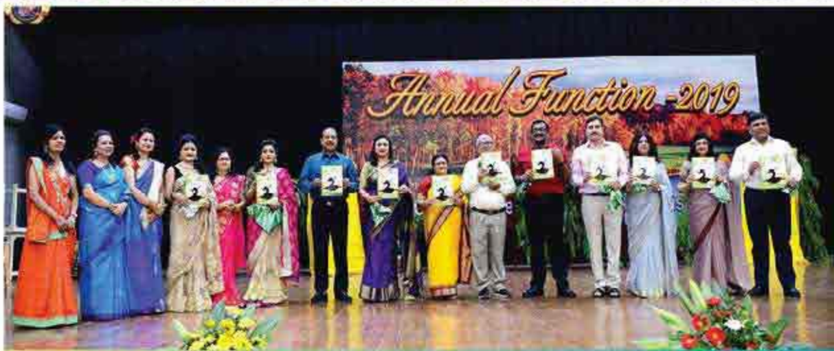
पत्रिका "पंख-अपूर्वा" का विमोचन