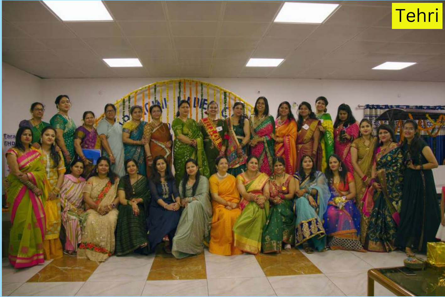
A Captivating Group Snapshot Captured During the Hariyali Teej Celebration by the Members of the Tarangini Officers Ladies Club, Tehri Project