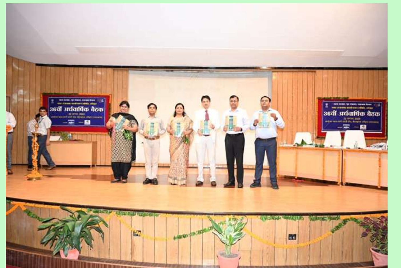
नराकास, हरिद्वार की 36वीं अर्धवार्षिक बैठक के आयोजन की कुछ झलकियाँ