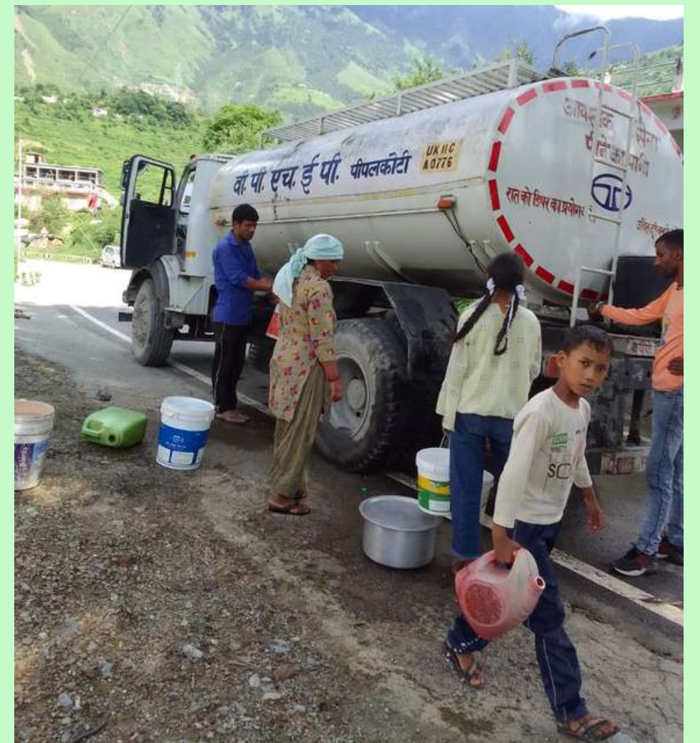
444 मे.वा. विष्णुगाड-पीपलकोटी जल विद्युत परियोजना द्वारा आपदा प्रभावित गांवों में राहत कार्यों के कुछ दृश्य