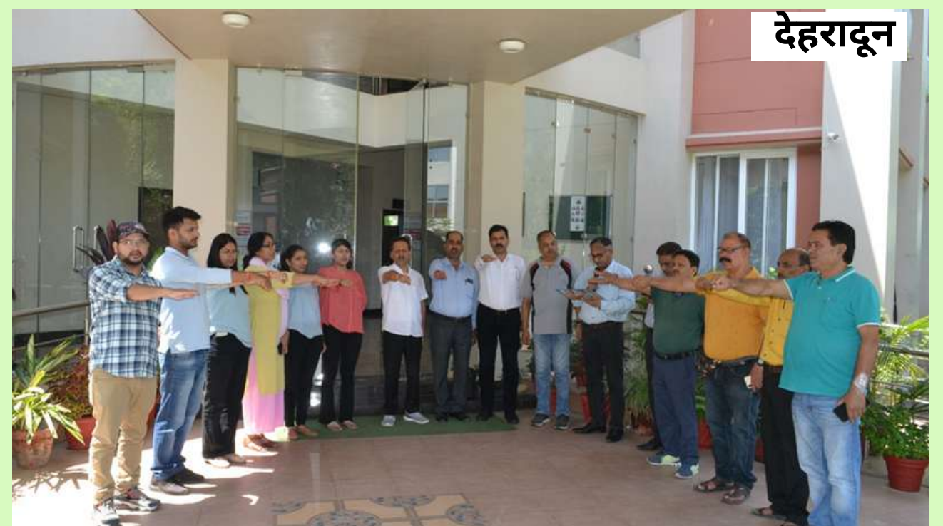
देहरादून कार्यालय में राष्ट्रीय खेल दिवस की शपथ ग्रहण का दृश्य।