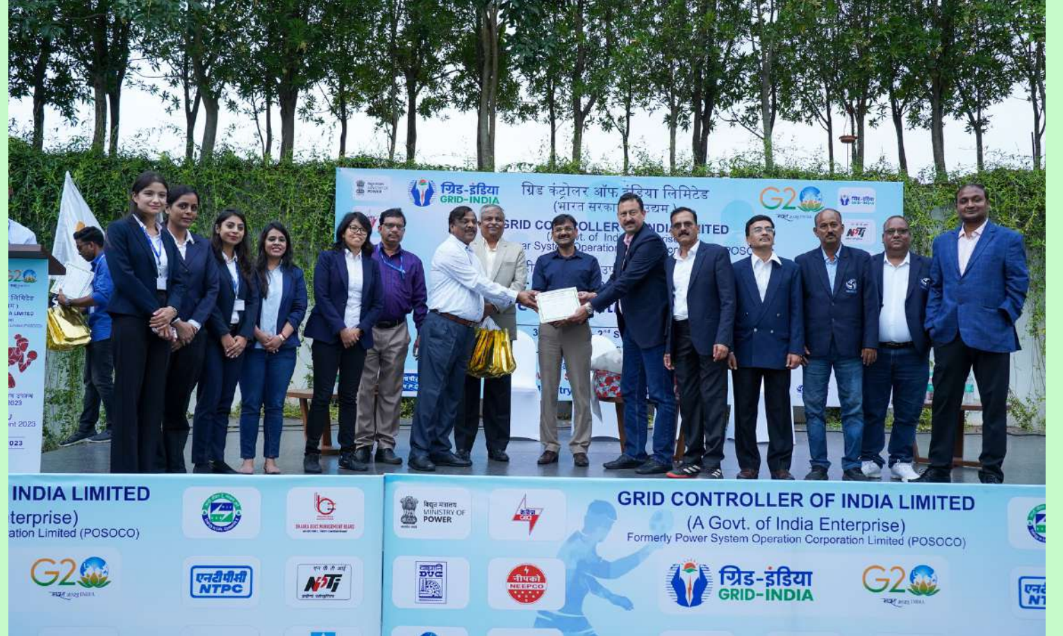
A Group photo of the THDCIL Team during the closing ceremony of the tournament