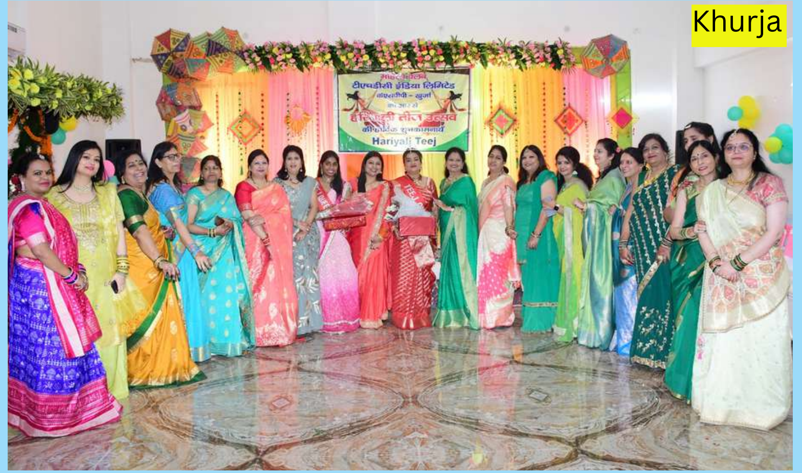
A Captivating Group Snapshot Captured During the Hariyali Teej Celebration by the Members of the Ladies Club, Khurja Super Thermal Power Project