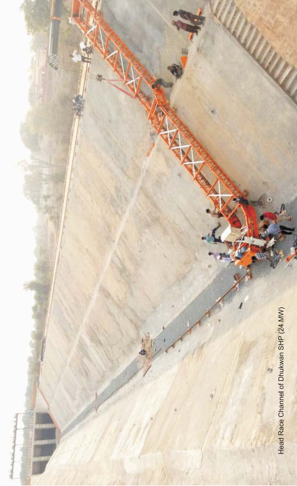
Head Race Channel of Dhukwan SHP (24 MW)