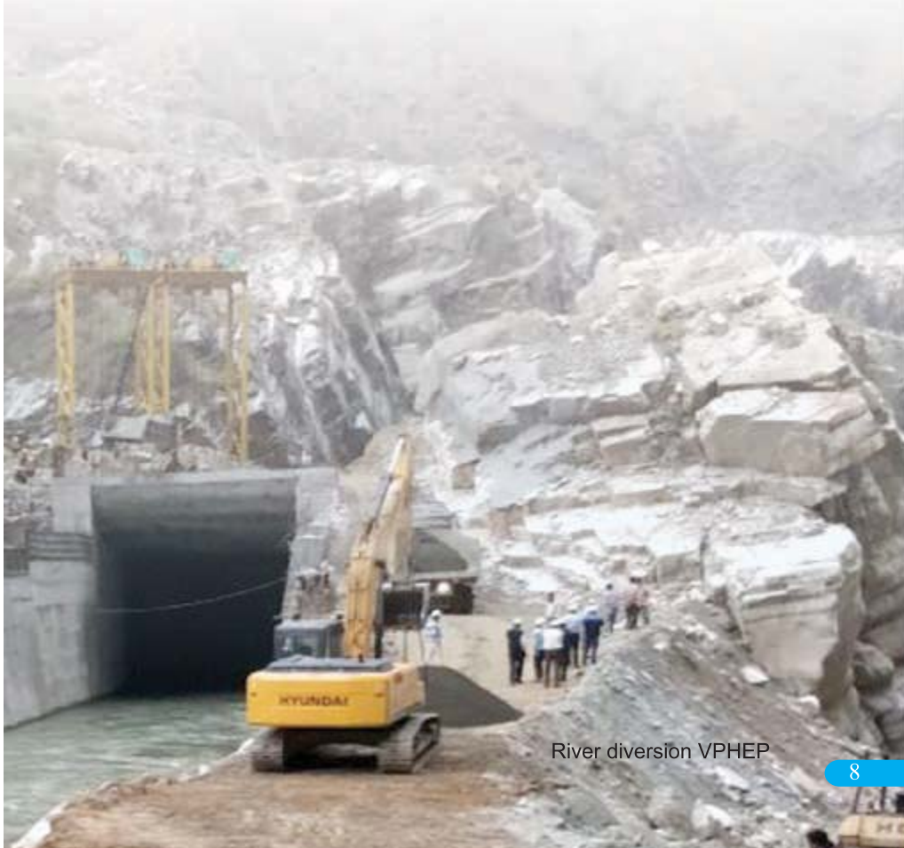
River diversion VPHEP