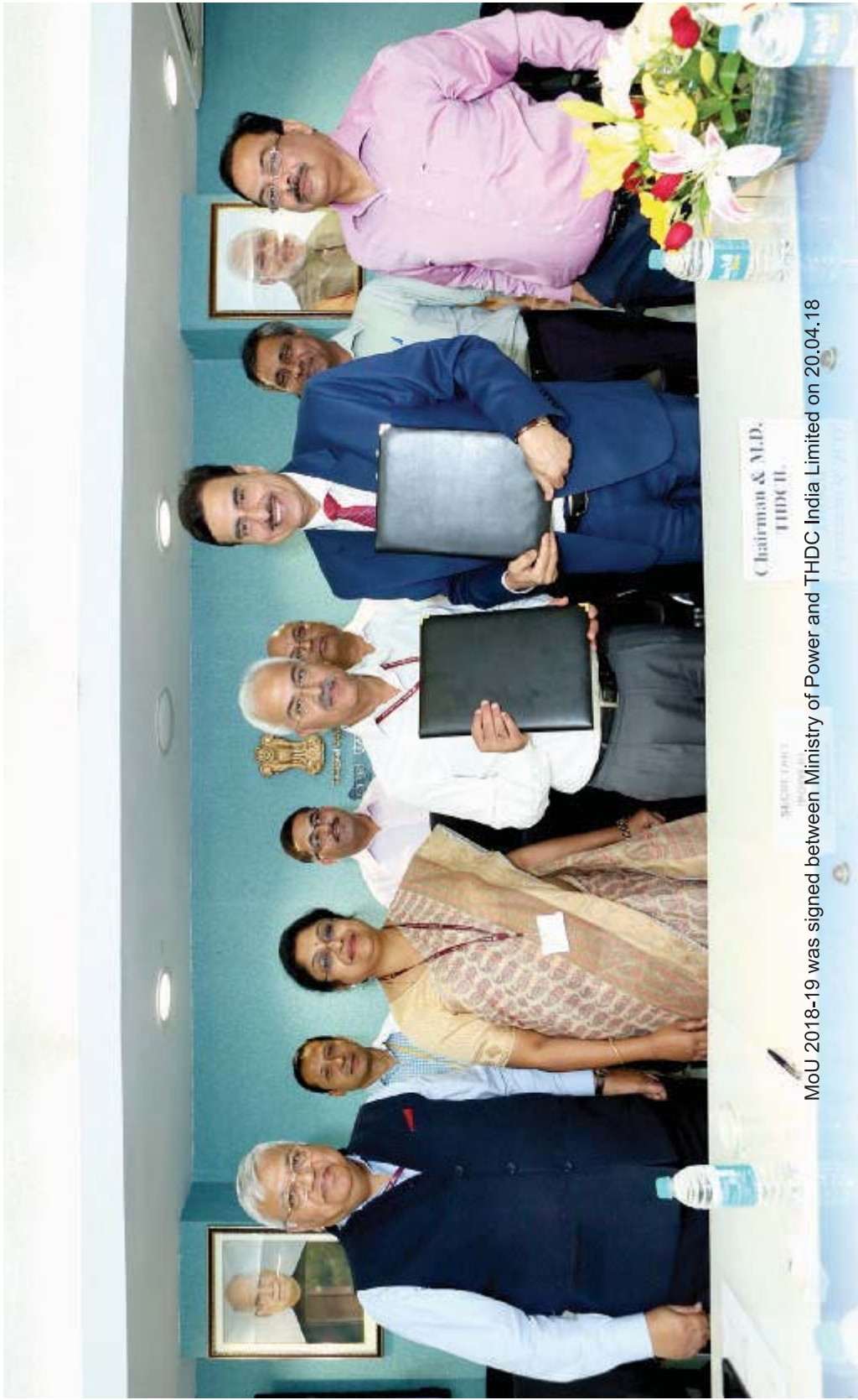
MoU 2018-19 was signed between Ministry of Power and THDC India Limited on 20.04.18