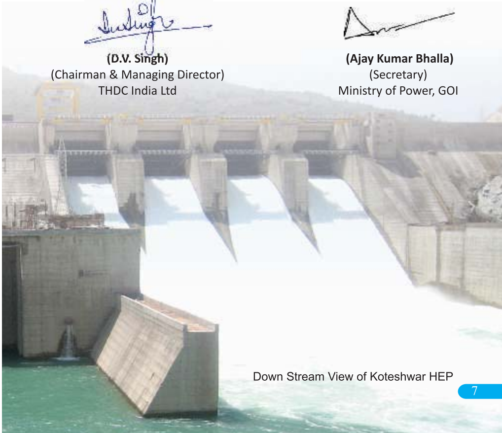
Down Stream View of Koteswar HEP