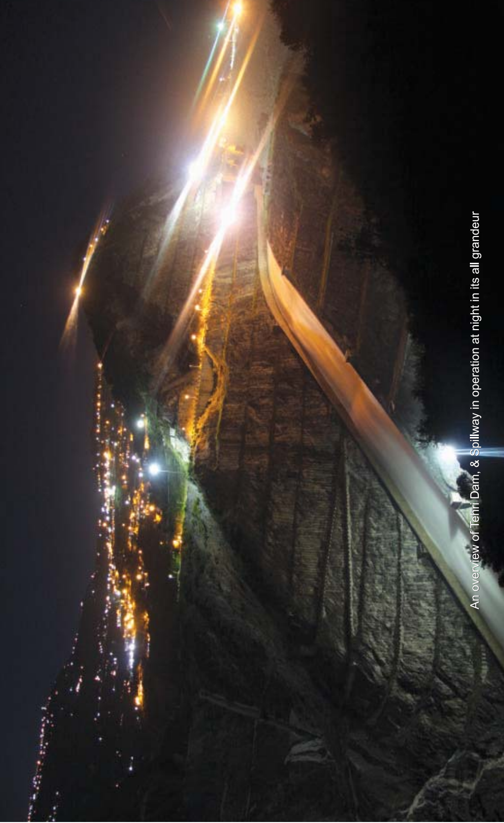
An overview of Tehri Dam, & Spillway in operation at night in its all grandeur