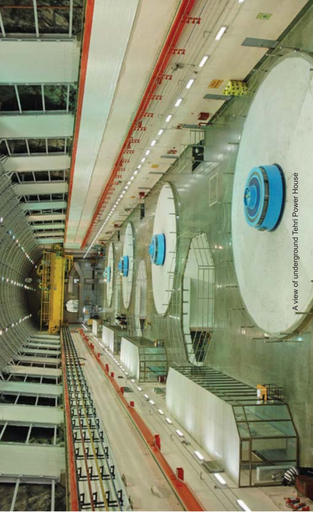
A view of underground Tehri Power House